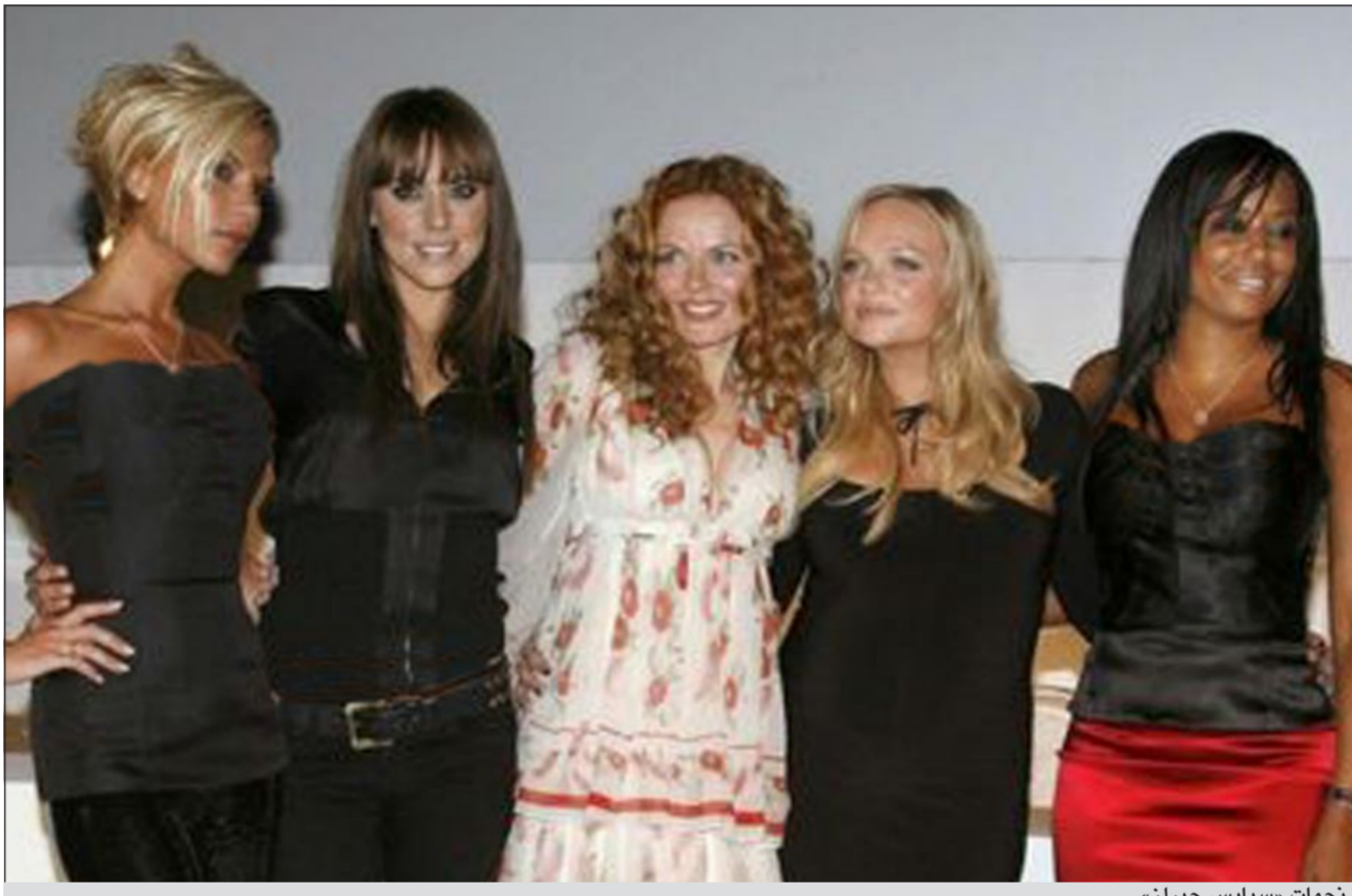
نجمات «سبايس جيرلز»

ولإعلان عن إطلاق العرض في فندق في وسط لندن، بحسب هيئة الإذاعة البريطانية (بي بي سي). ومن المتوقع بدء عرض المسرحية من تأليف الكاتبة الكوميدية جينيفر سونديرز في 11 ديسمبر على مسرح بيكاديلي في لندن.