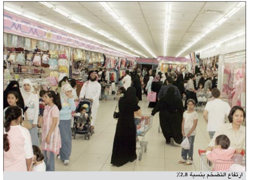
ارتفاع التضخم بنسبة 2,8%

الكويت - كونا: أظهرت بيانات الإدارة المركزية للاحصاء ارتفاع التضخم في الكويت بمعدل 2,8% في شهر مايو الماضي مقارنة بالشهر ذاته في 2011 حيث ارتفع الرقم القياسي السنوي من 147,4 نقطة حينها إلى 151,5 نقطة في حين انخفض معدل التضخم بنسبة 0,1% خلال مايو الماضي على أساس شهري مقارنة بشهر ابريل الماضي ليكون الانخفاض الثاني على التوالي.