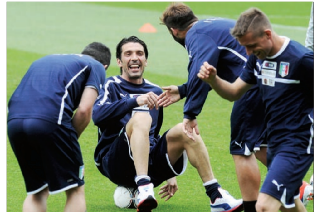
حارس إيطاليا جيانلويجي بوفون في لقطة طريفة خلال تدريبات «الأزوري» استعدادا لـ «الماكينات»

فمنذ عام 1988 تشهد البطولة الأوروبية كل ثمانية أعوام مباراة نهائية تجمع بين منتخبين التقيا في الجولة الأولى من دور المجموعات. فقد شهد نهائي بطولة عام 1988 لقاء المنتخب الهولندي مع منتخب الاتحاد السوفيتي كما واجه المنتخب الألماني نظيره التشيكي في نهائي يورو 1996. وواجه المنتخب البرتغالي نظيره اليوناني في نهائي يورو 2004. وفي البطولة الحالية، واجه المنتخب الإيطالي نظيره الإسباني في الجولة الأولى من مباريات دور المجموعات كما التقى المنتخب البرتغالي نظيره الألماني في الجولة نفسها.