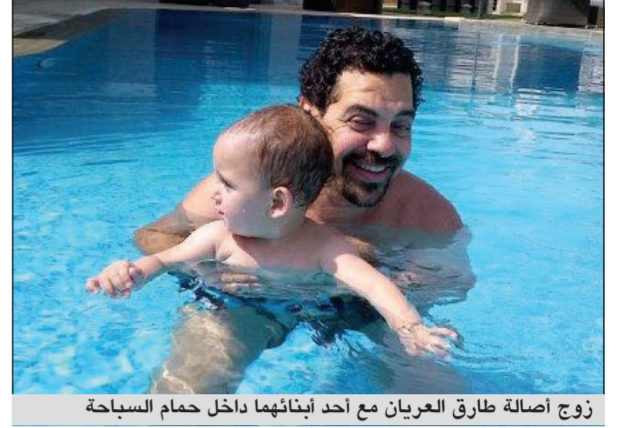
زوج أصالة طارق العريان مع أحد أبنائهما داخل حمام السباحة

بعد مرور عام على ولادتهما، أفرجت النجمة السورية أصالة عن أحدث صور لطفليها «علي وأدم»، وهما في حمام السباحة على حسابها الخاص بـ «تويتر». ودأبت أصالة عبر «تويتر»، بحسب ما ذكر موقع «الضنبرة»، إلى ما يقرب من 5 آلاف و500 شخص، حيث لاتزال النجمة السورية حديثة العهد بهذا الموقع، بينما بدأت علاقتها بـ فيس بوك منذ فترة أطول، ووصل عدد أعضاء صفحتها إلى مليون. واستقبلت النجمة السورية التهنئة من متابعيها عبر «تويتر» بعد انضمامها لتنادي المليون في «فيس بوك»، والذي يضم هيفاء وإليسا ونانسي عجرم وتامر حسني وعمرو دياب.