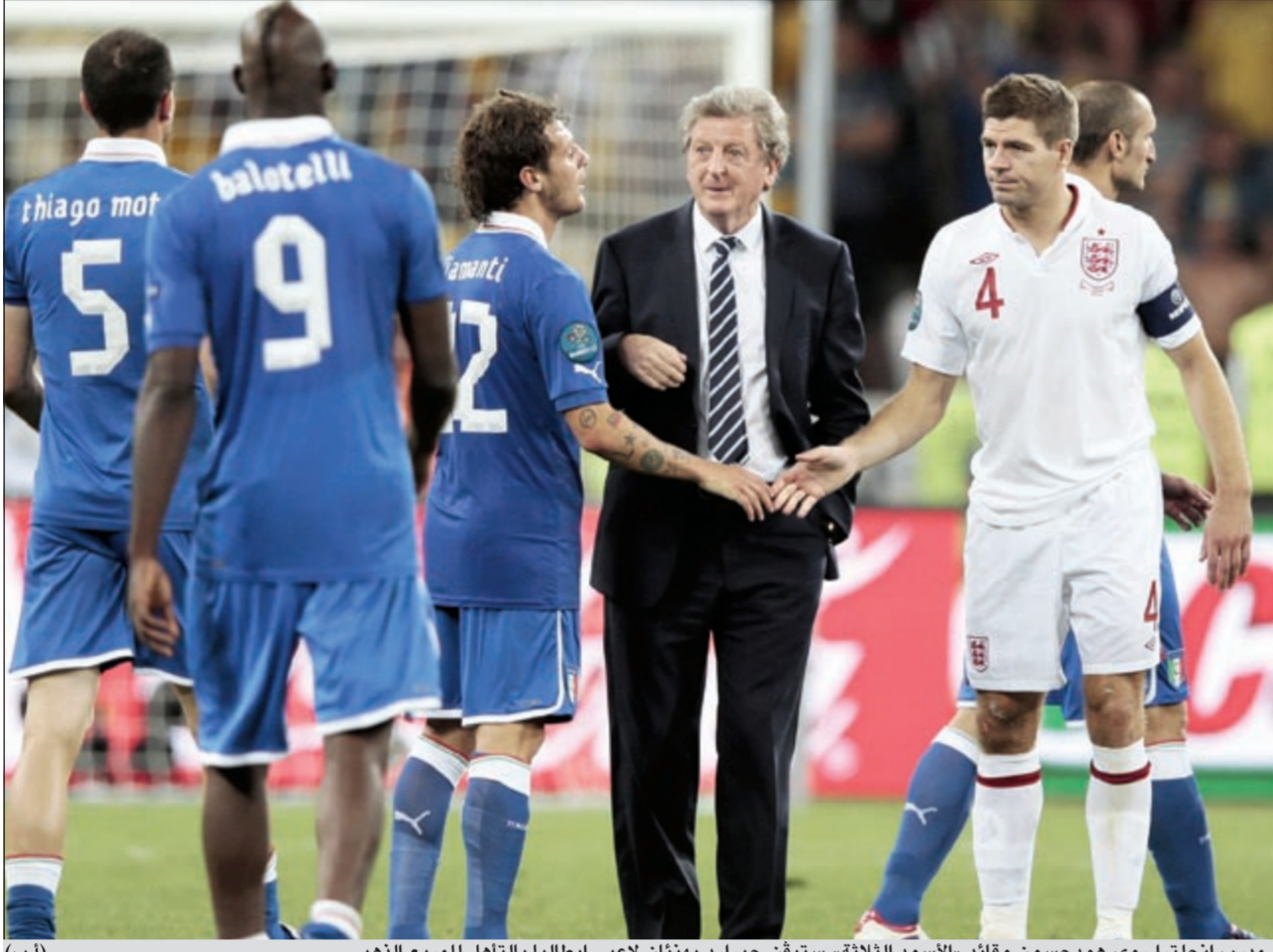
مدير إنجلترا روي هودجسون وقائد «الأسود الثلاثة» ستيفن جيرارد يهنئان لاعبي إيطاليا بالتأهل للمربع الذهبي