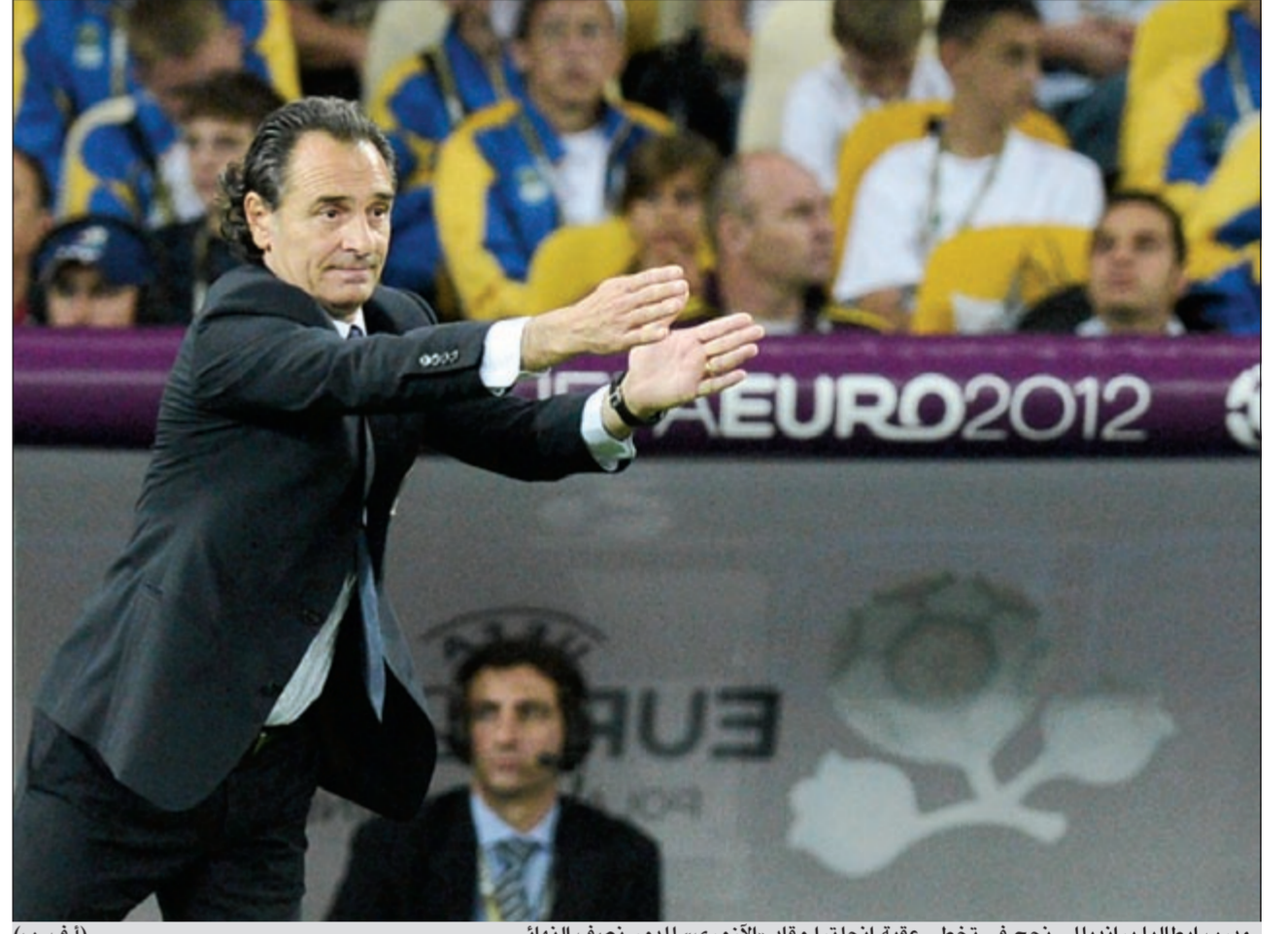
مدير إيطاليا برانديللي نجح في تخطي عقبة إنجلترا وقاد «الأزوري» للدور نصف النهائي

والحالي مان يونابنت، لكن تسديد الركلات وسط الضغوطات مختلف تماماً. في المقابل اعتبر مهاجم إنجلترا واين روني أنه من الصعب تقبل الهزيمة بهذه الطريقة بقوله «امر طبيعي أن نشعر بالخيبة من الخروج خصوصاً أنه حصل مرات عدة بهذه الطريقة». وتابع «أمل أن يأتي يوم نحسم فيه ركلات الترجيح في مصلحتنا». وكان لسان حال جيرارد مماثلاً بقوله «بذل اللاعبين جهوداً كبيرة، واعتقد لوهملة بأن الحظ سيقف إلى جانبنا خصوصاً بعد أن تقدمنا في ركلات الترجيح، لكن هذا الأمر لم يحصل». وتابع «قام الشباب بعمل رائع ونعود إلى البلاد مرفوعي الرأس لكن قلوبنا محطمة ومن الصعب تقبل هذا الأمر. لم يكن الرأي العام الإنجليزي يتوقع الكثير منا في هذه البطولة لكننا أثبتنا أننا فريق قوي».