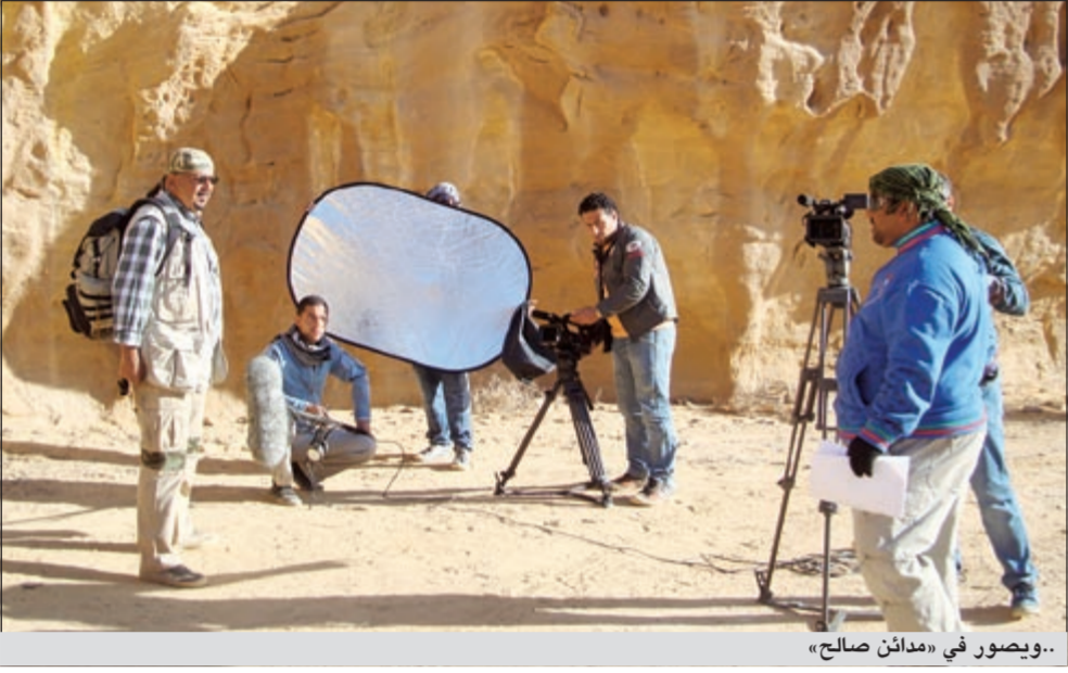
..ويصور في «مدائن صالح»