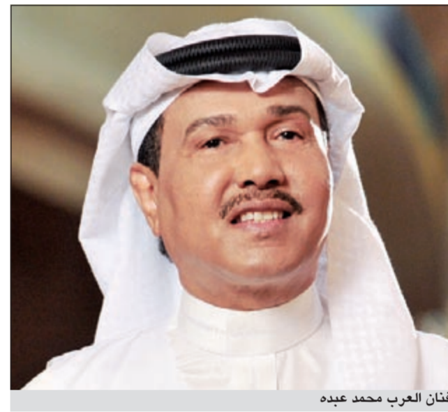
فنان العرب محمد عبده

المغارات والقلاع والحصون والمواقع الأثرية والسياحية ليقدّم للمشاهد الخليجي