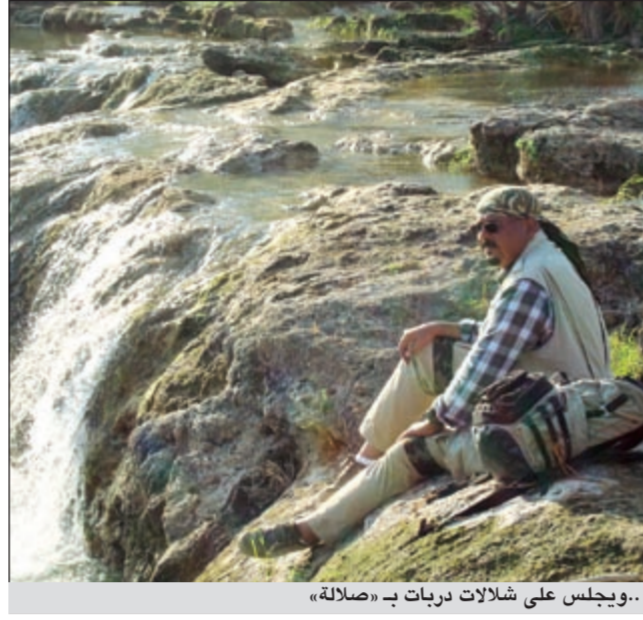
..ويجلس على شلالات دربات ب «صلاة»