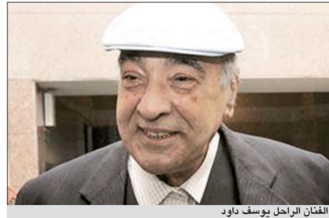
الفنان الراحل يوسف داود

تشهداها مصر، إذ أقيمت مراسم الجنازة قبل ساعتين فقط من إعلان نتائج انتخابات الرئاسة، بينما أرجع آخرون غياب الفنانين إلى بعد مسافة الجنازة. وخلال القداس، ألقى الابن ابرام عن «الكتيسة المرقسية» كلمة تناولت رسالة الفنان الراحل، ورسائله في افلامه وأعماله الفنية.