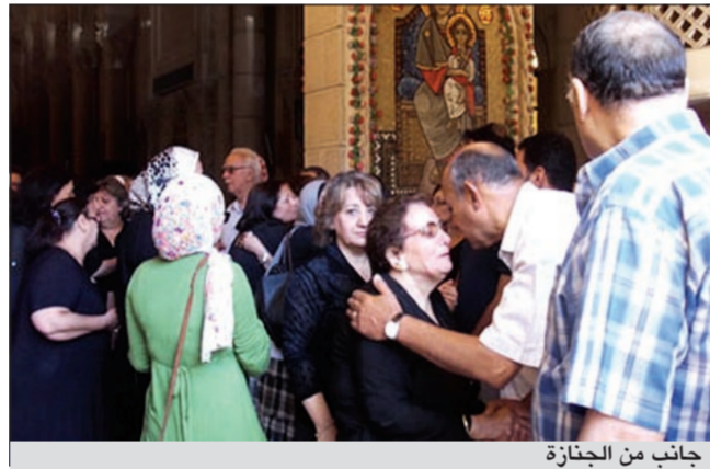
جانب من الجنازة

وقد انهارت كل من زوجته وابنته خلال الجنازة، وظلت الأخيرة تبكي بشدة، كذلك قررت زوجته إقامة عزاء له في القاهرة خلال الأيام المقبلة.