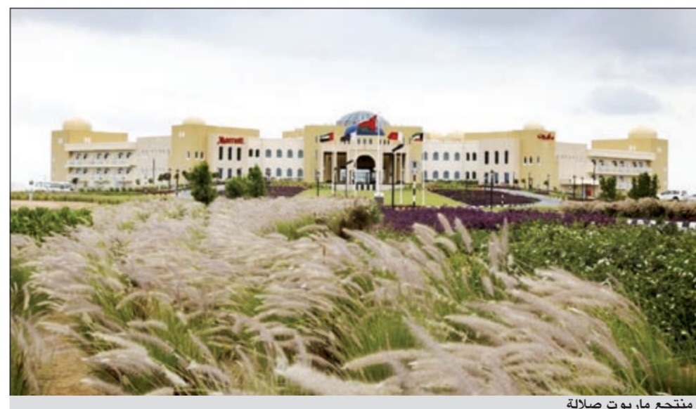
منتجع ماريوت صلالة