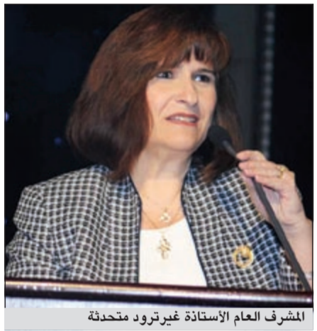
المشرفة العام الأستاذة غيرتروود متحدثة