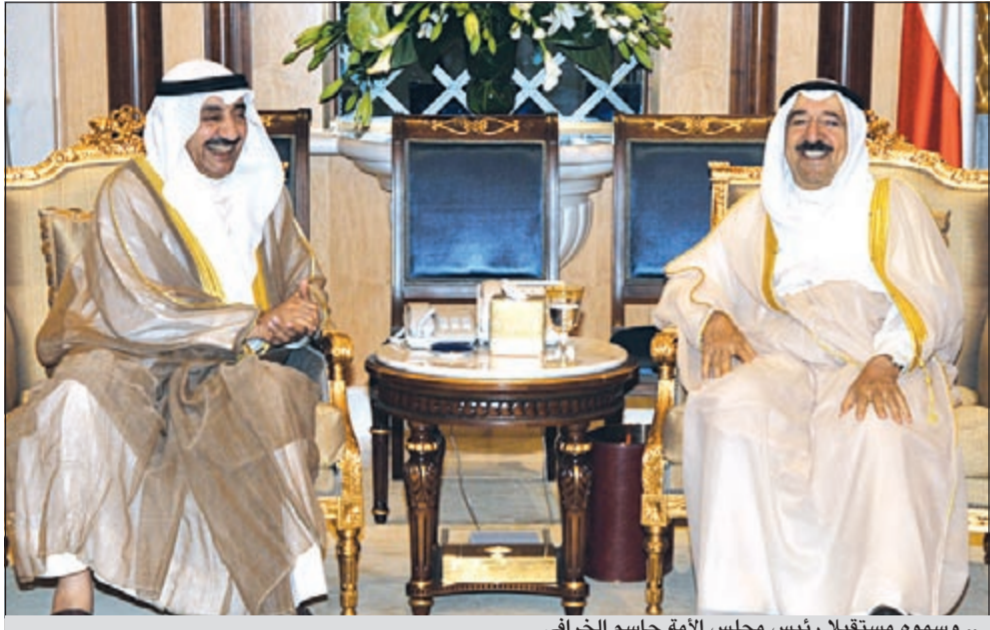
.. وسموه مستقبلا رئيس مجلس الأمة جاسم الخرافي