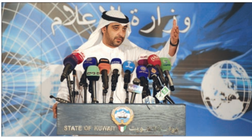
وزير الاعلام الشيخ محمد العبدالله خلال المؤتمر الصحافي أمس

دورها التشريعي فعليها أداء القسم الثاني، مؤكداً أنه بإمكان الحكومة الجديدة حل مجلس 2009 دون أداء القسم أمامه. وبالنسبة لانعقاد مجلس 2009 في ظل استقالة الحكومة ذكر العبدالله ان استقالة الحكومة لا تؤثر على دور الانعقاد، لافتاً الى ان الاستقالة ما هي إلا من باب الحيلة والحذر. وعن وجود محفل من مجلس 2009 للحكومة الجديدة أوضح العبدالله ان تعيين الوزراء وفقاً للدستور من أعضاء مجلس الأمة أو من غيرهم، لافتاً الى ان أحد أسباب استقالة الحكومة هو عدم وجود محفل من المجلس المبطل. وعن بيان الأغلبية حول دستورية المادة 50 من الدستور والخاصة بالفصل بين السلطات يجب ان تكون مبداً معروفاً ومعلوماً لدى الجميع.