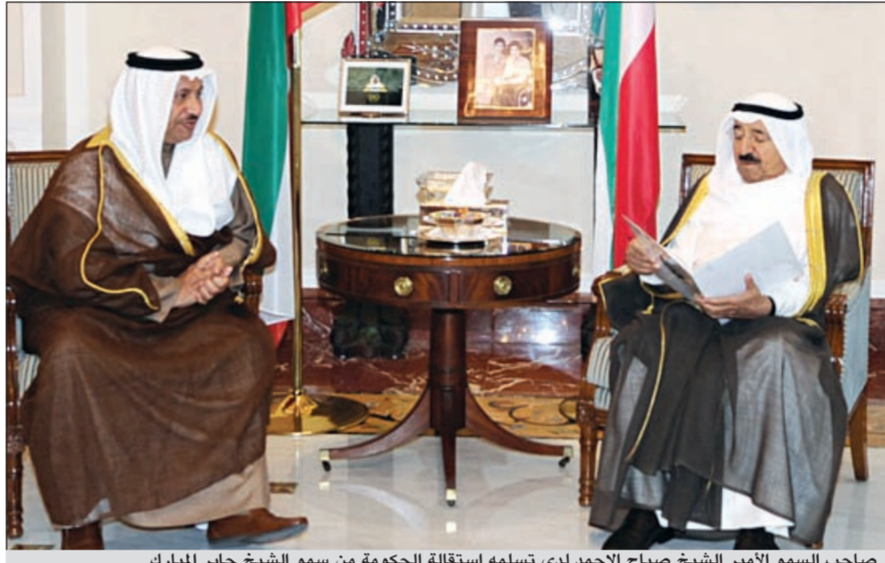
صاحب السمو الأمير الشيخ صباح الأحمد لدى تسلمه استقالة الحكومة من سمو الشيخ جابر المبارك