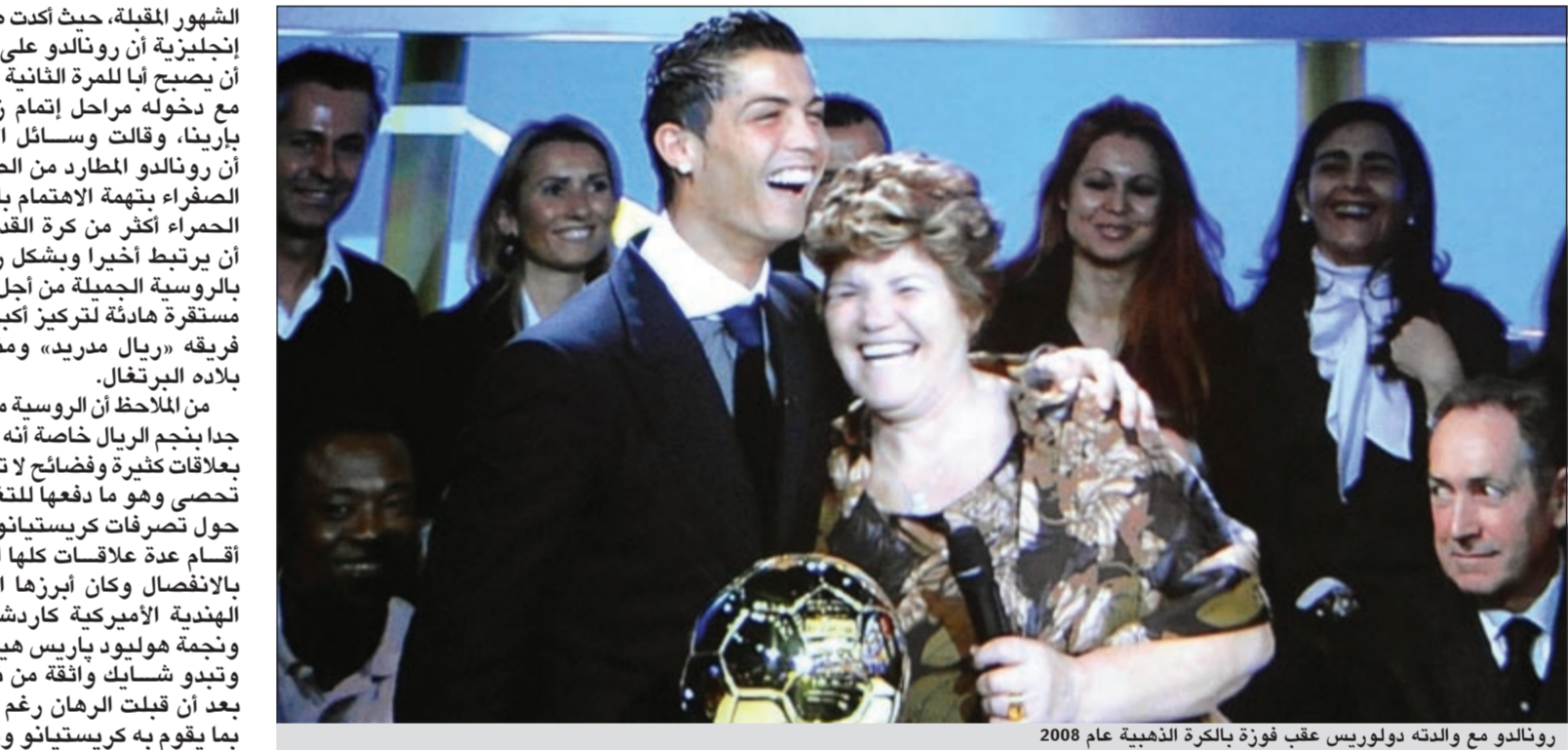
رونالدو مع والدته دولوريس عقب فوزه بالكرة الذهبية عام 2008

الشهور المقبلة، حيث أكدت صحف إنجليزية أن رونالدو على وشك أن يصبح أباً للمرة الثانية تزامناً مع دخوله مراحل إتمام زواجه ببارينا، وقالت وسائل الإعلام أن رونالدو المطارد من الصحف الصفراء بتهمة الإهتمام بليلاليه الحمراء أكثر من كرة القدم قرر أن يرتبط أخيراً وبشكل رسمي بالروسية الجميلة من أجل حياة مستقرة مائة لتركيز أكبر على فريقه «ريال مدريد» ومنتخب بلاده البرتغال.