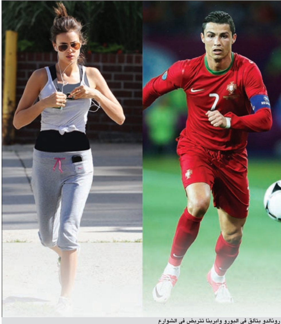
رونالدو يتالق في اليورو وإيرينا تيريش في الشوارع

● نجوم ريال مدريد في مباراة إسبانيا والبرتغال وفي مقدمتهم رونالدو وكاسياس، والمواجهة بينهما ستجذب المشاهد لا يقل عنهما، وفي ظلنا أن رونالدو سيسجل هدفا وإسبانيا ستفوز.