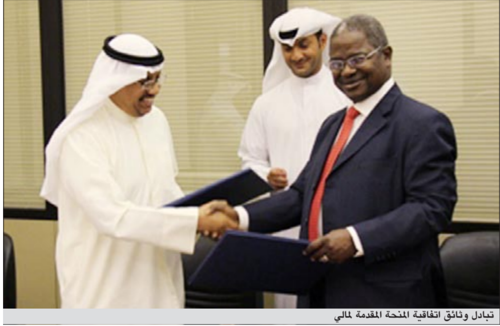
تبادل وثائق اتفاقية المنحة المقدمة مالي

أعلن الصندوق الكويتي للتنمية الاقتصادية العربية أمس عن توقيع اتفاقية منحة في مالي قيمتها 5 ملايين دولار للإسهام في تمويل مشروعات صغيرة ومتناهية الصغر في القطاع الزراعي فيها وذلك من موارد صندوق الحياة الكريمة للمساهمة في تمويل مشروعات توفير الأمن الغذائي. وقال الصندوق الكويتي في بيان صحافي ان المنحة التي ستكون من خلال صندوق التنمية الاقتصادية في مالي تهدف إلى المساهمة في تحقيق الأمن الغذائي وزيادة إنتاج الغذاء من خلال توفير القروض لتمويل المشاريع الصغيرة والصغرى في مجال إنتاج الغذاء وتوفير الخدمات المساندة لذلك.