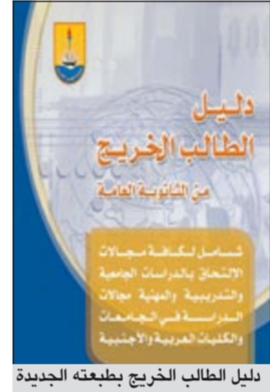
دليل الطالب الخريج بطبعته الجديدة