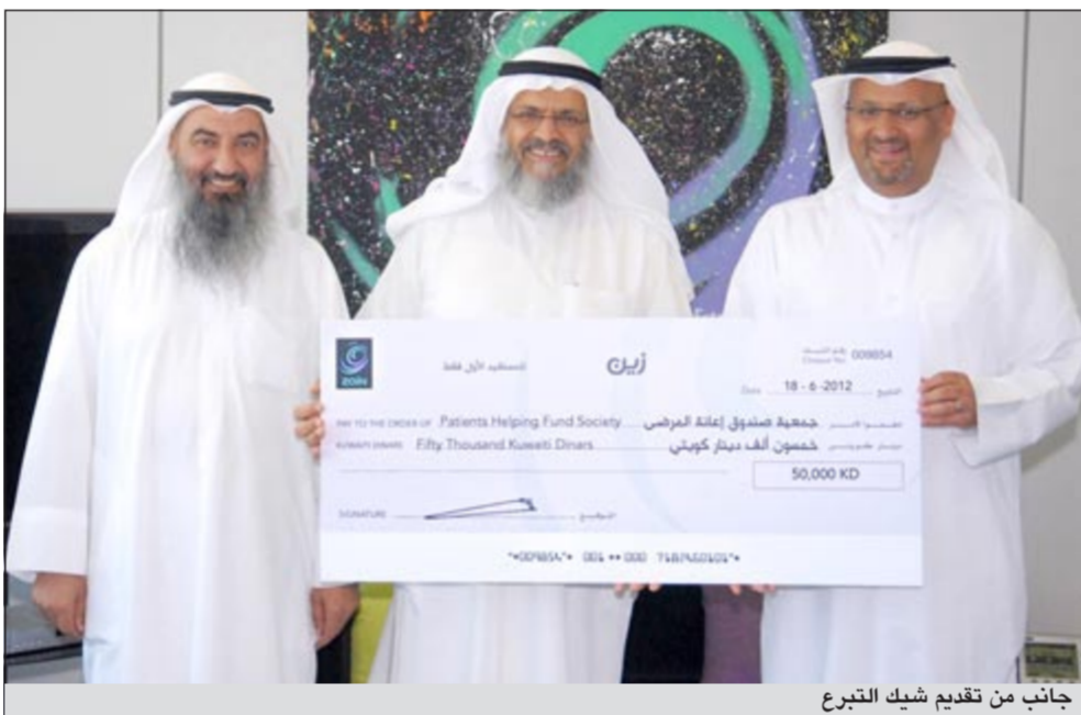
جانب من تقديم شيك التبرع