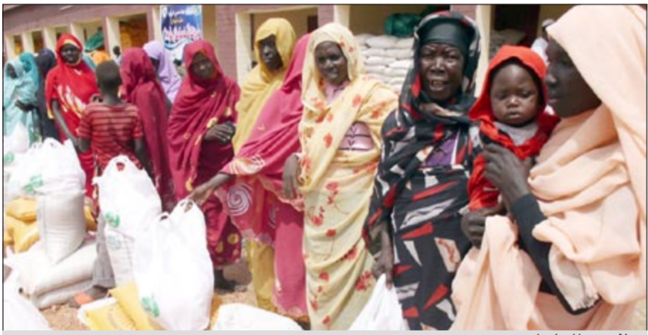
جانب من المساعدات

القبادات الرسمية والشعبية وفي مقدمتهم حاكم محلية «الدينج» حسن توابي فضل الذي أشاد بجهود ومواقف أعضاء أهل الكويت وتضامنتهم مع الشعب السوداني في كل الظروف، كما حيا جهود جمعية العون المباشر للمساهمة في تقديم العون والمساعدات الإنسانية ومشاركتها في مشروعات وبرامج التنمية بالسودان والولاية على وجه الخصوص.