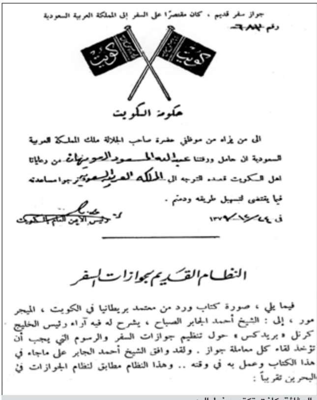
جواز سفر قديم - كان مقصراً على السفر إلى المملكة العربية السعودية