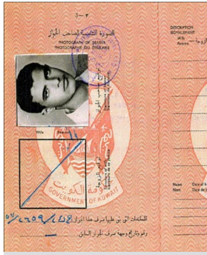
النظام القديم لجوازات السفر

وقال الباحث والكاتب في التراث الكويتي د. يعقوب الغنيم إن حكومة الكويت لم تكن تصدر جوازات سفر في بدايات القرن الماضي بالشكل المتعارف عليه، حيث كانت أسفار أهل الكويت تتجه إلى بلدان محدودة وعلاقتها الخارجية محكومة بالاتفاقيات مع الإمبراطورية البريطانية. وأوضح الغنيم في لقاء مع «كونا» أنه منذ الثلاثينيات من القرن الماضي كان الراغبون في السفر يتجهون إلى مكتب سكرتير الأمير ملا صالح بن عبد الملا بصفته سكرتير الشيخ أحمد الجابر الصباح حاكم الكويت العاشر، حيث كان مكتب السكرتير تسند إليه مهمة إصدار وثائق السفر للمواطنين الكويتيين. وأضاف أن الوثائق كانت تكتب بخط اليد وغير مطبوعة وتؤدي الغرض منها، وهي تعريف اسم حاملها وموطنه في خارج الكويت، مشيراً إلى أن الجوازات أو وثائق السفر كانت بسيطة جداً.