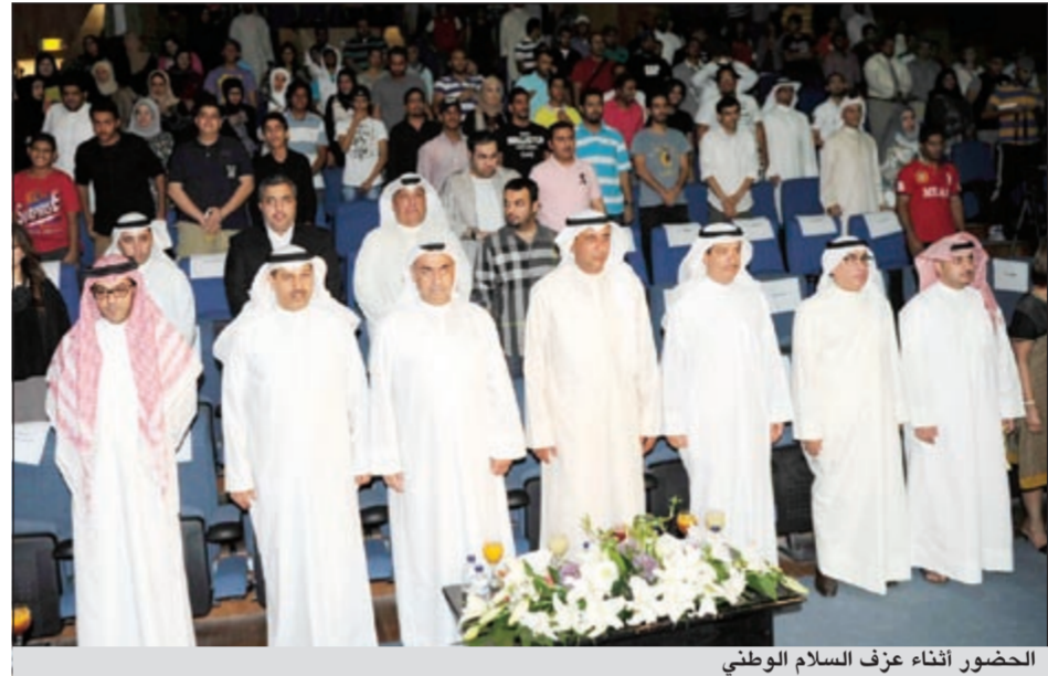
الحضور أثناء عزف السلام الوطني