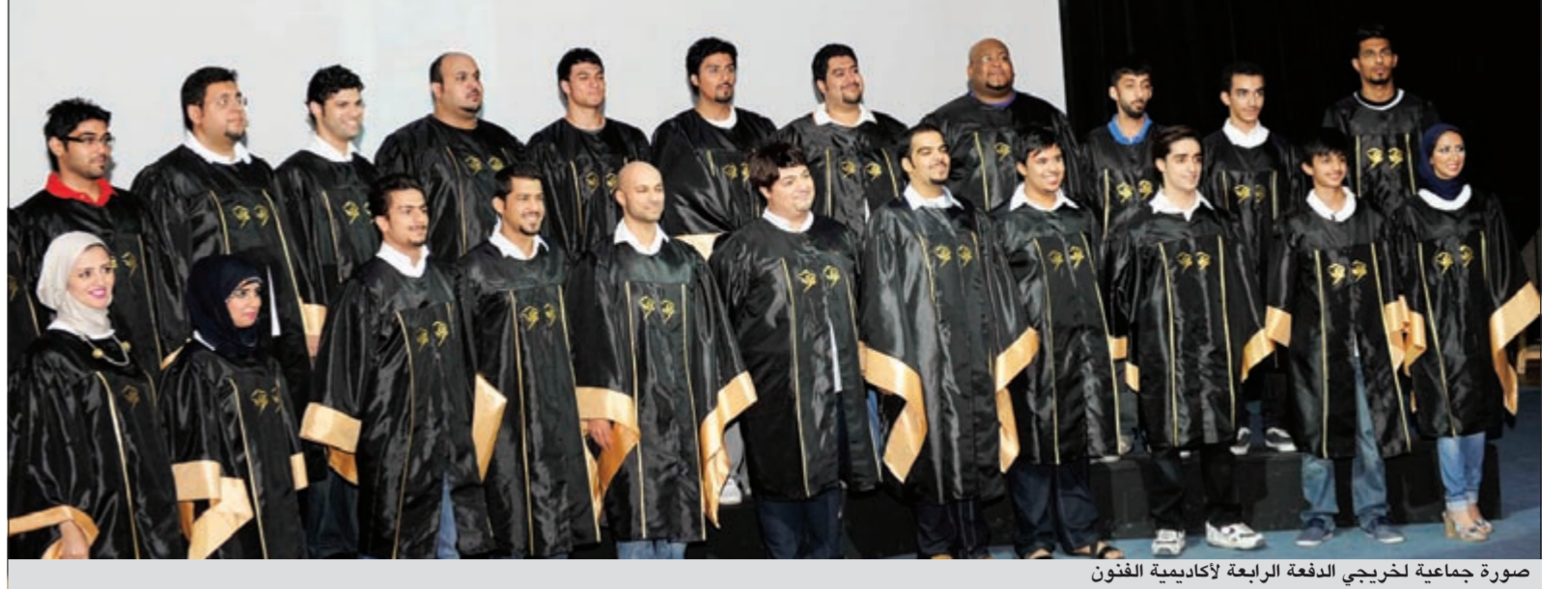
صورة جماعية لخريجي الدفعة الرابعة لأكاديمية الفنون

ملحن وعد مطربة شابة انه راح يساعدها في مشوارها الغنائي، بس بعدما طلب منها فلوس علشان يبليش الشغل، رفضت هالمطربة انها تعطيه الفلوس.. يا عيني على النصب!