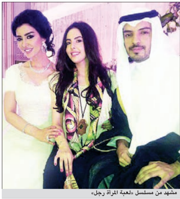
مشهد من مسلسل «لعبة المرأة رجل»