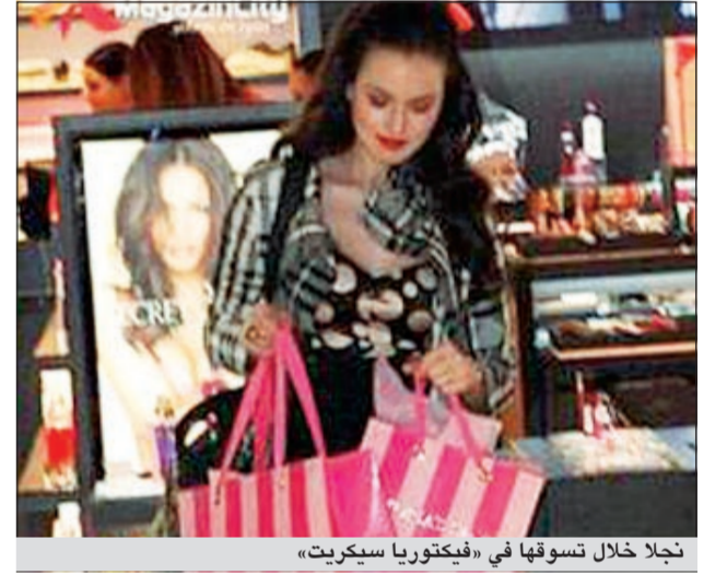
نجلا خلال تسوقها في «فيكتوريا سيكريت»

ظهرت الممثلة التركية فخرية أفعان المعروفة باسم نجلا في مسلسل «الأثوارق المتساقطة»، وهي تتجول في المحل التجاري الخاص بـ «فيكتوريا سيكريت»، الذي يبيع أدوات التجميل في مجمع نيسانتاسي. وقد لفتت الأنظار بملابسها المثيرة حيث كانت ترتدي تنورة قصيرة اضافة الى قميص مكشوف الصدر، وحول سبب تواجدها في مركز التسوق، اكدت نجلا انها كانت تستري هدية عيد ميلاد لاحدى صديقاتها.