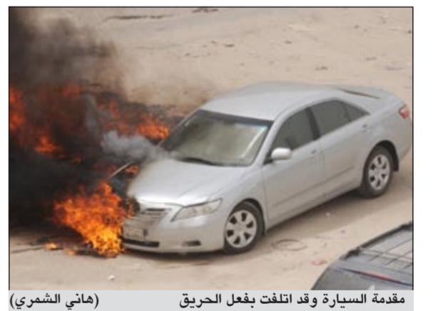
مقدمة السيارة وقد اطلقت بفعل الحريق