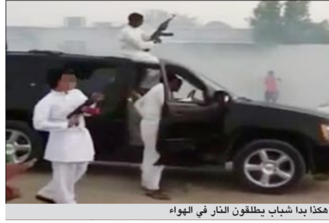
هكذا بدا شباب يطلقون النار في الهراء

الي عمليات الداخلية عن اطلاق نار وقيام عدد من المركبات بالتشفيث نوع كلاشينكوف خاصة وان صورته وحرروا عدة مخالفات مرورية، فيما كلف رجال ادارة بحث وتحرري