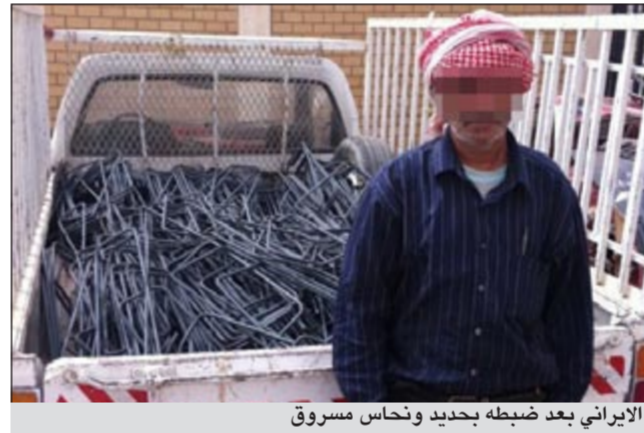
الإيراني بعد ضبطه بحديد ونحاس مسروق

واصلت مديرية امن الجهراء فرض طوق امني على منطقة سكراب أمفرة بقصد تحقيق الانضباط في هذه المنطقة عقب وقوع سلسلة من الحرائق المتعددة، واسفر الانتشار المنظم والذي جاء تحت اشراف