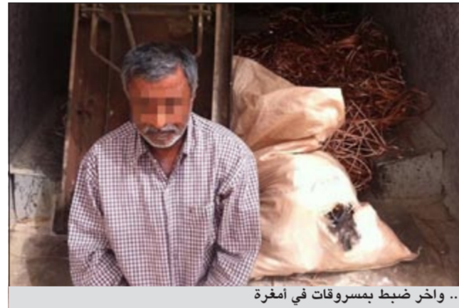
.. واخر ضبط بمسروقات في أمفرة

والحالة الوافدين الى الاختصاص كما ضبط رجال امن الجهراء وافدا بحملان كمية من النحاس المسروق داخل مركبات خاصة بهما وكانا بصدر بيعها في مسرقات أمفرة حيث تم الحفظ على المسروقات