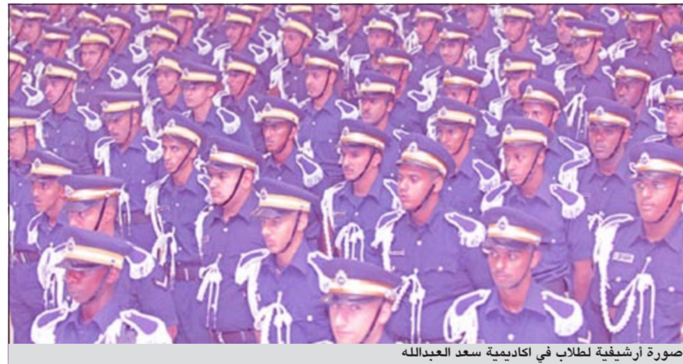
صورة أرشيفية لطلاب في أكاديمية سعد العبدالله

ويستثنى من هذا الشرط الطلبة الكويتيون الموقد أولياء أمورهم في مهمة رسمية أو بعبئة دراسية من قبل الدولة أو أبناء أعضاء الهيئة الدبلوماسية العاملين خارج دولة الكويت.. بالإضافة إلى