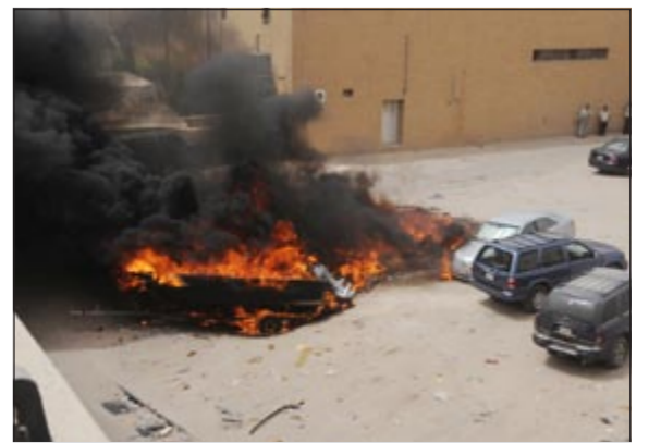
الدخان يتصاعد في الشيوخ