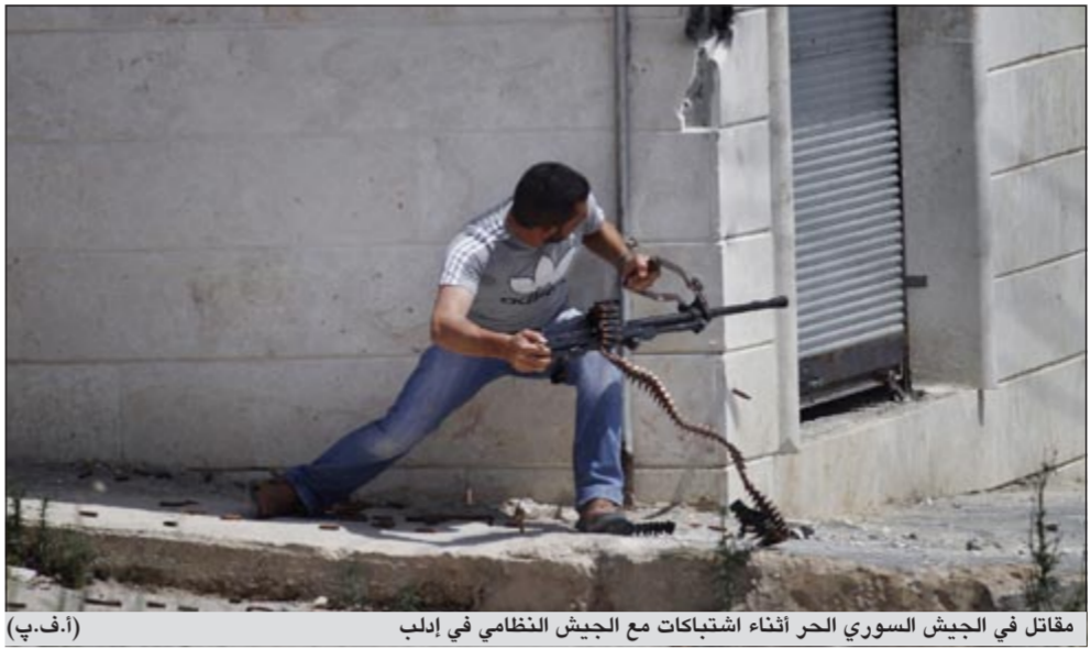
مقاتل في الجيش السوري الحر أثناء اشتباكات مع الجيش النظامي في إبلب