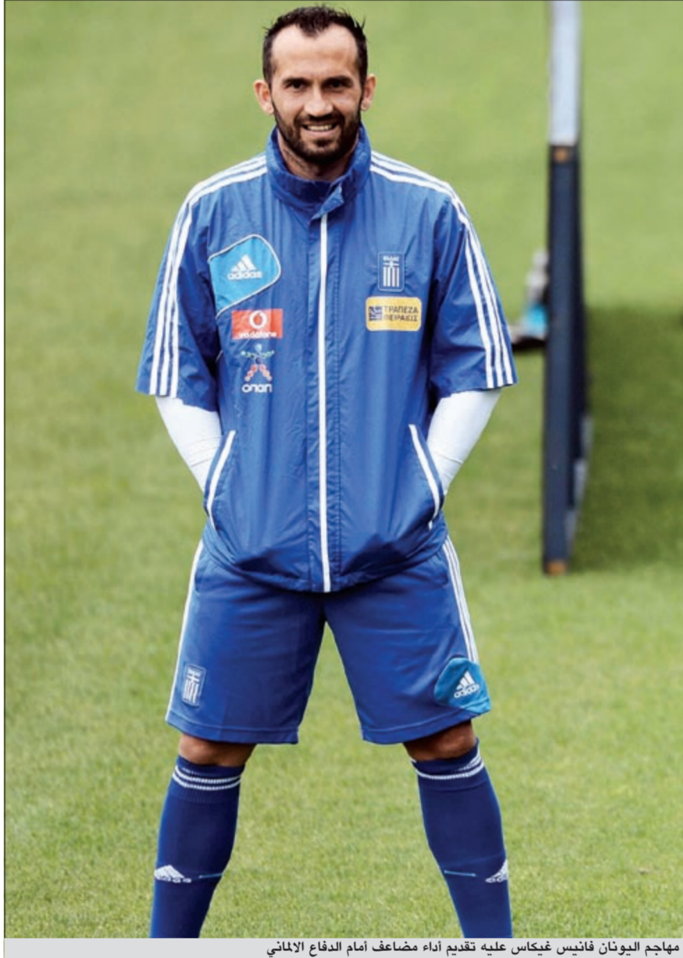
مهاجم اليونان فانيس غيكاس عليه تقديم أداء مضاعف أمام الدفاع الألماني

أقر مدرب ألمانيا يواكيم لوف بأن «أحدنا لم يكن يتوقع تأهل اليونان»، قبل أن يحذر من المنافس الذي وصفه بأنه «بطل الفعالية». وتحت قيادة الألماني أوتو ريهغل، فاز اليونانيون بلقب نسخة البطولة عام 2004 بالبرتغال، وقال لوف المنهجر بكفاح لاعبي منافسه المقل، الذين اعتبرهم «تحدياً» أمام فريقه: «من بطولات سابقة نعرف بالفعل أنهم يمكنهم الدفاع بطريقة ممتازة، وأنهم عنيدون للغاية». وأضاف لوف الذي يبدو أنه وصل بفريق تسلمه بعد مونديال 2006 الذي أقيم في بلاده، إلى أعلى مستوياته «كما نضجتاً كذلك». ووجه رئيس الاتحاد الألماني فولفغانغ نيرسباخ بعض الكلمات إلى اللاعبين من مدياع الطائفة «تماسكم رائع. فقط يمكنني أن أطلبكم بمواصلة هذه الروح. إنكم فريق رائع ويجب عليكم معرفة أن ألمانيا كلها وراءكم».