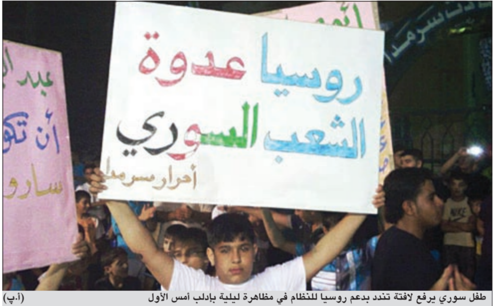
طفل سوري يرفع لافتة تندد بدعم روسيا للنظام في مظاهرة ليلية بابل أمس الأول (أ.ب)

عواصم - وكالات: فيما كانت القذائف تنهال على الرستن وحماة ومعررة العثمان وعدد من المدن السورية الأخرى موقعة المزيد من القتلى والجرحى، أعلنت اللجنة الدولية للصليب الأحمر عن استعدادها لدخول الأحياء المحاصرة من قبل القوات السورية، لإجلاء مدنيين بعدما تلقت موافقة السلطات والمعارضين.