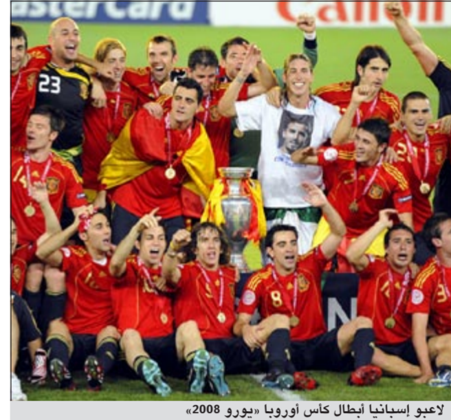
لاعبو إسبانيا أبطال كأس أوروبا «يورو 2008»

هرنانديز مع الألماني مسعود أوزيل على الفوز بلقب أفضل لاعب في البطولة.