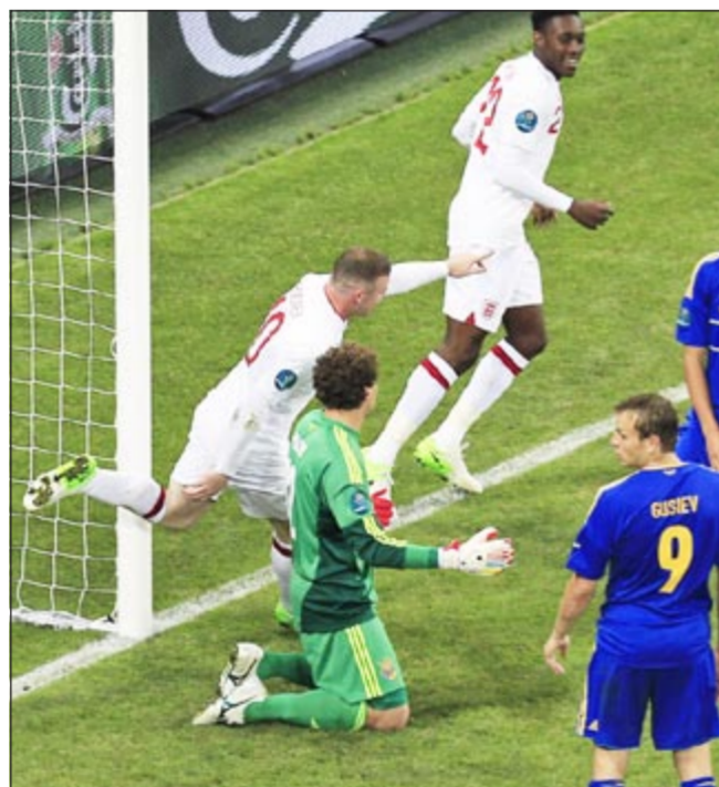
روني يحتفل بهدفه في مرمرى اوكرانيا