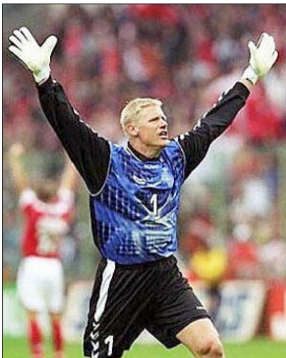
شمايكل حارس مرمرى أسطورة قاد الدنمارك للفوز بلقب 1992