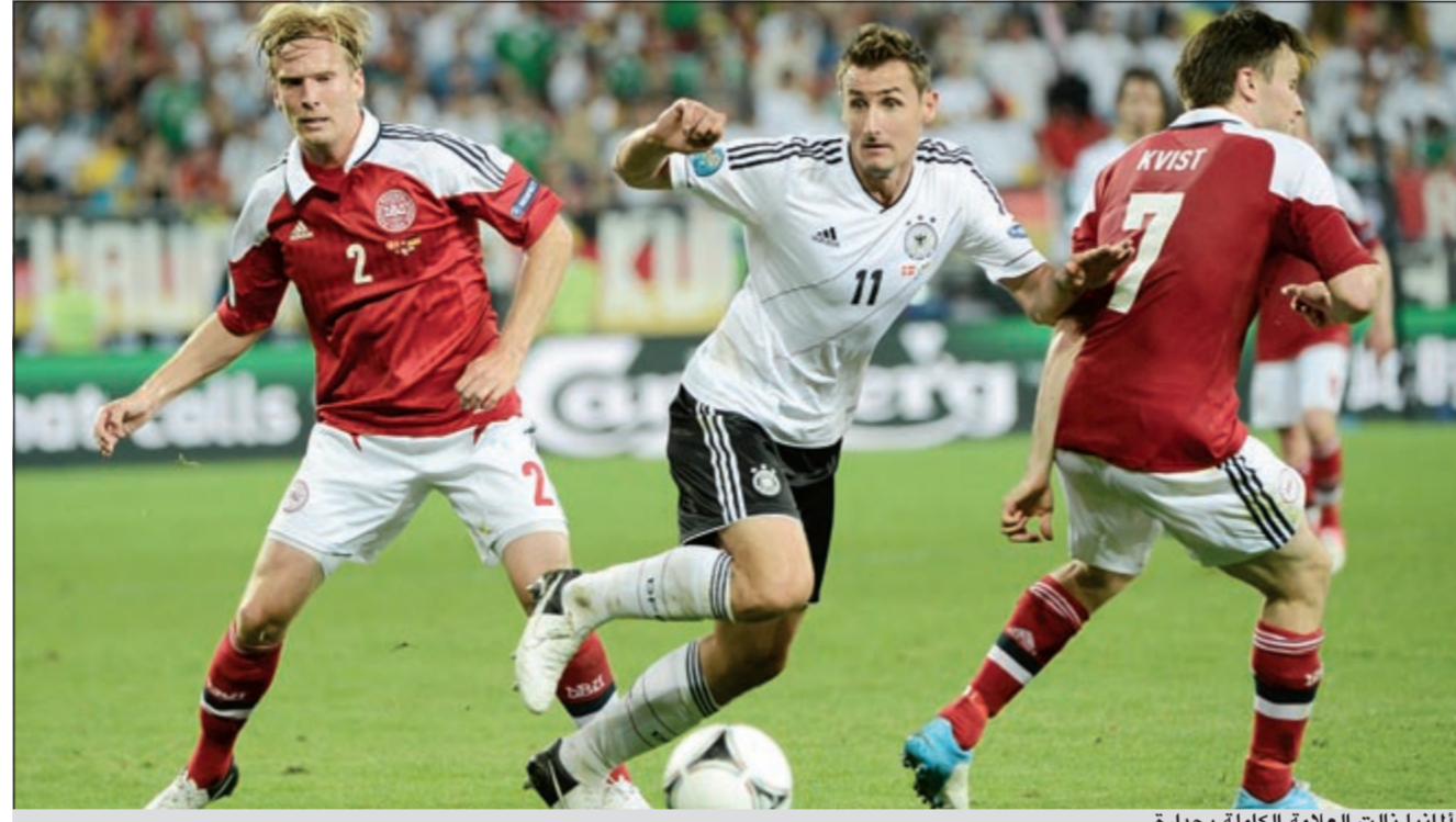
ألمانيا تالت العلامة الكاملة بجدارة

60 هدفاً بالدور الأول في 24 مباراة بلا أي تعادل سلبي