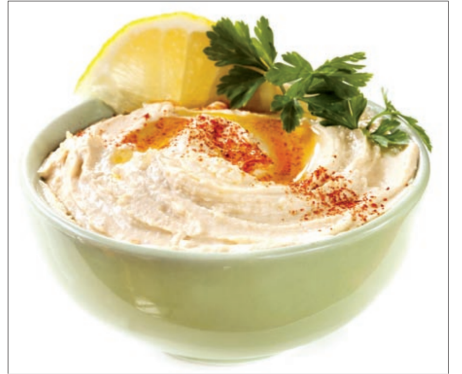
طبق الحمص على الطريقة الروشنية

صرح نائب المدير العام لشؤون الزراعة والثروة السمكية توفيق الحداد بأن كافة المواقع التابعة للهيئة في الدائرة الانتخابية الخامسة مزروعة بالكامل، موضعا أن هناك عدد (3) حدائق قيد الإنشاء الأولى في منطقة العدان قطعة (8) ومساحتها (8140) متراً مربعاً والثانية في منطقة العدان أيضاً قطعة (2) ومساحتها (4140) متراً مربعاً، أما الثالثة ففي منطقة القرين قطعة (3) ومساحتها (6000) متر مربع. هذا بالإضافة إلى مجموعة أخرى من الحدائق قيد