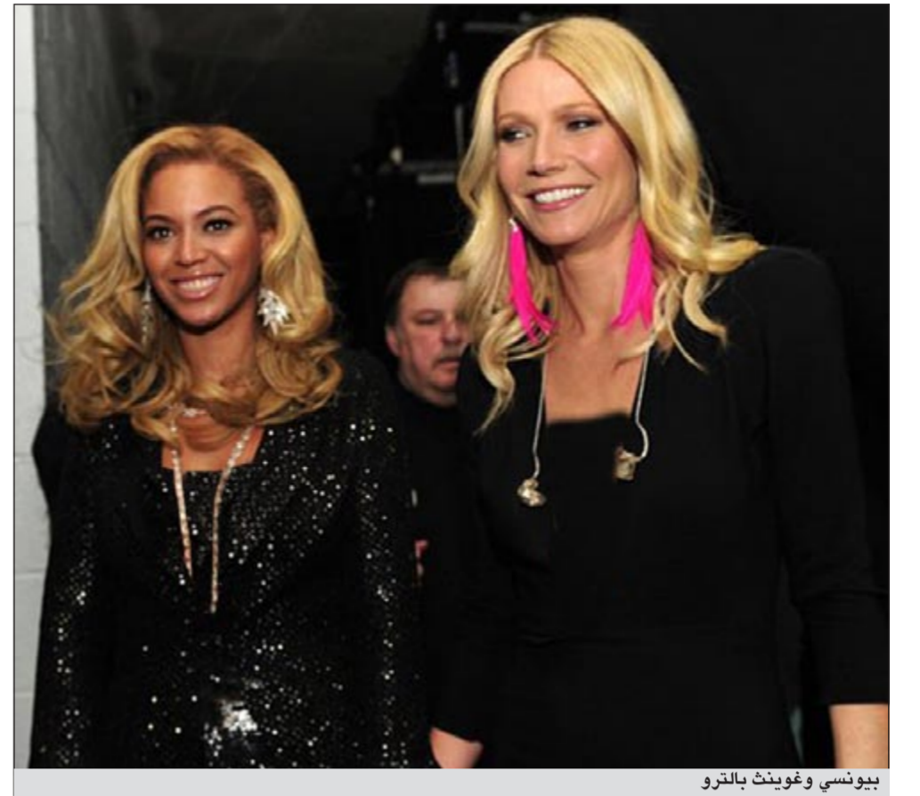
بيونسي وغوينث بالترو

لندن - د.ب.أ. يبدو أن المغنية الأميركية الشهيرة بيونسي حريصة على استكمال أعمالها الغنائية والفنية بعدما توقفت لفترة بعد انجابه لطفلتها بلسو أيفي. وذكرت صحيفة «ذا صن» البريطانية في عددها الصادر أمس أن بيونسي لجأت للممثلة غوينث بالترو لمساعدتها في استكمال مسيرتها الفنية وأداء أدوار جديدة بعيداً عن الشخصية