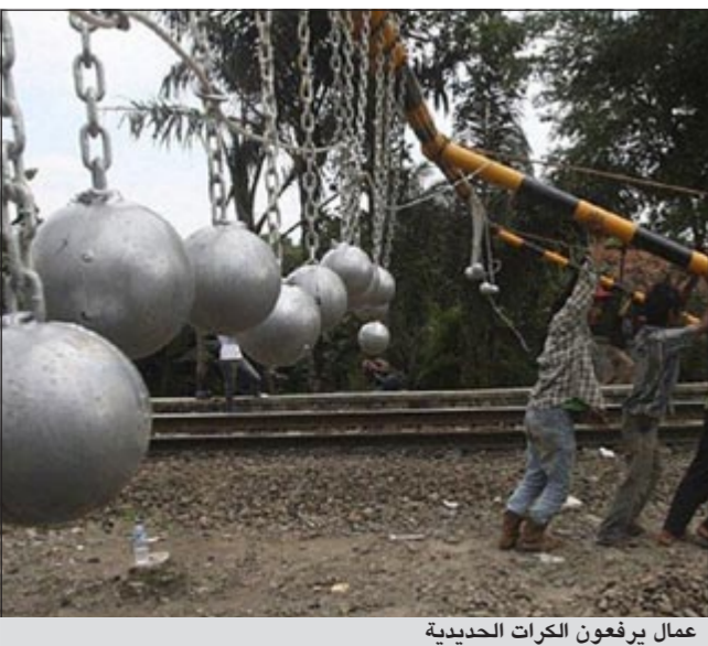
عمال يرفعون الكرات الحديدية

وكالات: قررت الشرطة الإندونيسية استخدام وسيلة قاسية للغاية قد تتسبب في قتل المتسلقين وهي تعليق كرات اسمنتية على حواجز ترفع في أماكن متعددة من مناطق مرور القطارات، ويصل حجم الكرات الاسمنتية التي تم تعليقها فوق القطارات لحجم حبة البرتقال، وتم تعليقها بسلاسل حديدية، فنتوقع الاسمنتية ان تحذف هذه الكرات الاسمنتية من هذه الظاهرة وتنتهيها بحيث ستتسبب هذه الكرات باصابات خطيرة للراكبين على اسقف القطارات هذا ان لم تقذفهم من على سطح القطار بالكامل.