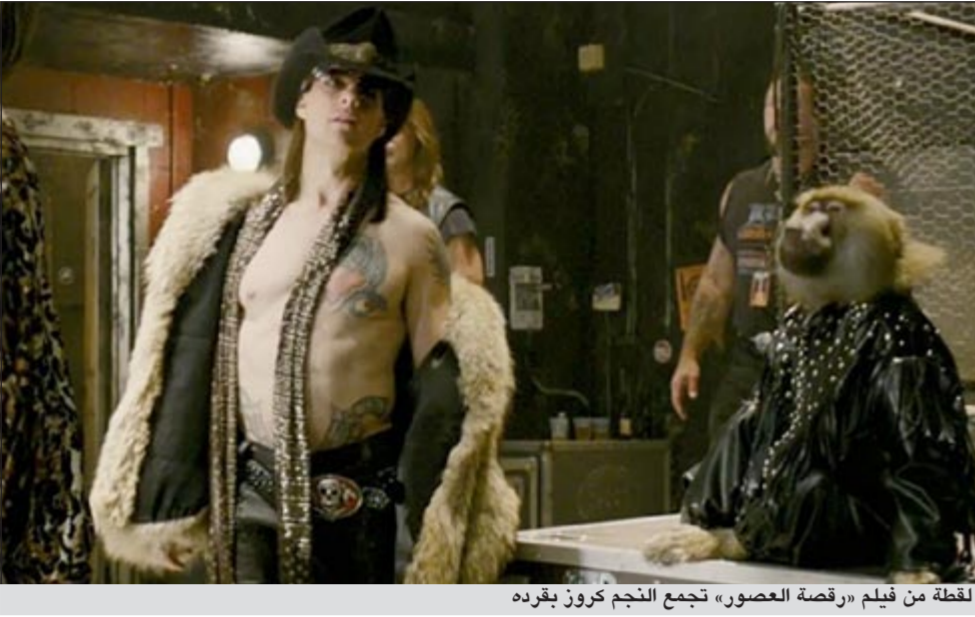
لقطة من فيلم «رقصة العصور» تجمع النجم كروز بفرده

لوس انجليس - أ.ش.أ. يحكي النجم العالمي توم كروز الكثير من القصص الطريفة التي دارت في كواليس فيلم «رقصة العصور»، ومنها قصة هروب القرد الذي كان يرافقه في الفيلم أثناء التصوير. ويظهر كروز في الفيلم وهو يحمل قرداً ويتحدث إليه، وحدث أن هرب القرد منه ذات مرة بينما كان يتحدث إليه، ليشتبع الفوضى والهرج في كواليس الفيلم، ويتوقف التصوير، بعد أن كان القرد قاب قوسين أو أدنى من غرس أنيابه في وجه النجم العالمي وهو يحاول الهرب، بعد أن نجح في فك قيوده. وقال كروز إن القرد جرى منه وانطلق في الطرقات