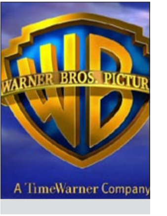
A Time Warner Company

نيويورك - أ.ف.ب. عبرت استوديوهات «وورنر برونز» عن «سعادتها الكبيرة» أول أمس بعد أن رد قاض من نيويورك الدعوى التي تقدم بها مصمم الأحذية الفرنسي لوي فويتون مطالباً فيها الاستوديوهات السينمائية بدفع تعويض غير محدد القيمة لأنها أظهرت في أحد الأفلام حقيبة مزيفة تحمل توقيع فويتون. واعتبر القاضي الفيدرالي أندرو كارتر أن لوي فويتون لم يقدم أدلة تدعم دعواه، وقرر بالتالي رد الدعوى. وكان لوي فويتون قد تقدم بالشكوى ضد «وورنر برونز» في ديسمبر 2011 لأن الاستوديوهات أظهرت في مقدمة