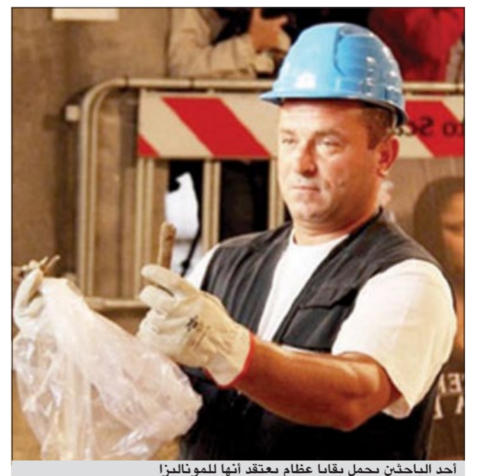
أحد الباحثين يحمل بقايا عظام يعتقد أنها للموناليزا

روما - يو.بي.أي. يستأنف علماء الآثار الإيطاليون البحث عن بقايا المرأة الخبيثة التي رسمت في لوحة الموناليزا التي تعود إلى ما قبل 500 عام. وطلبت سلطات منطقة فلورنسا حيث دفنت ليزا غيرارديني في العام 1542 باستئناف البحث عن بقاياها. وكان العلماء يعتقدون أنهم عثروا على بقاياها في مايو 2011 عندما وجدوا قبراً يحتوي على هيكل عظمي لامرأة. ويتفق معظم المؤرخين المعاصرين على أن المرأة التي رسمت في لوحة الموناليزا هي ليزا غيرارديني التي توفيت في يوليو 1542 في سن 63 عاماً.