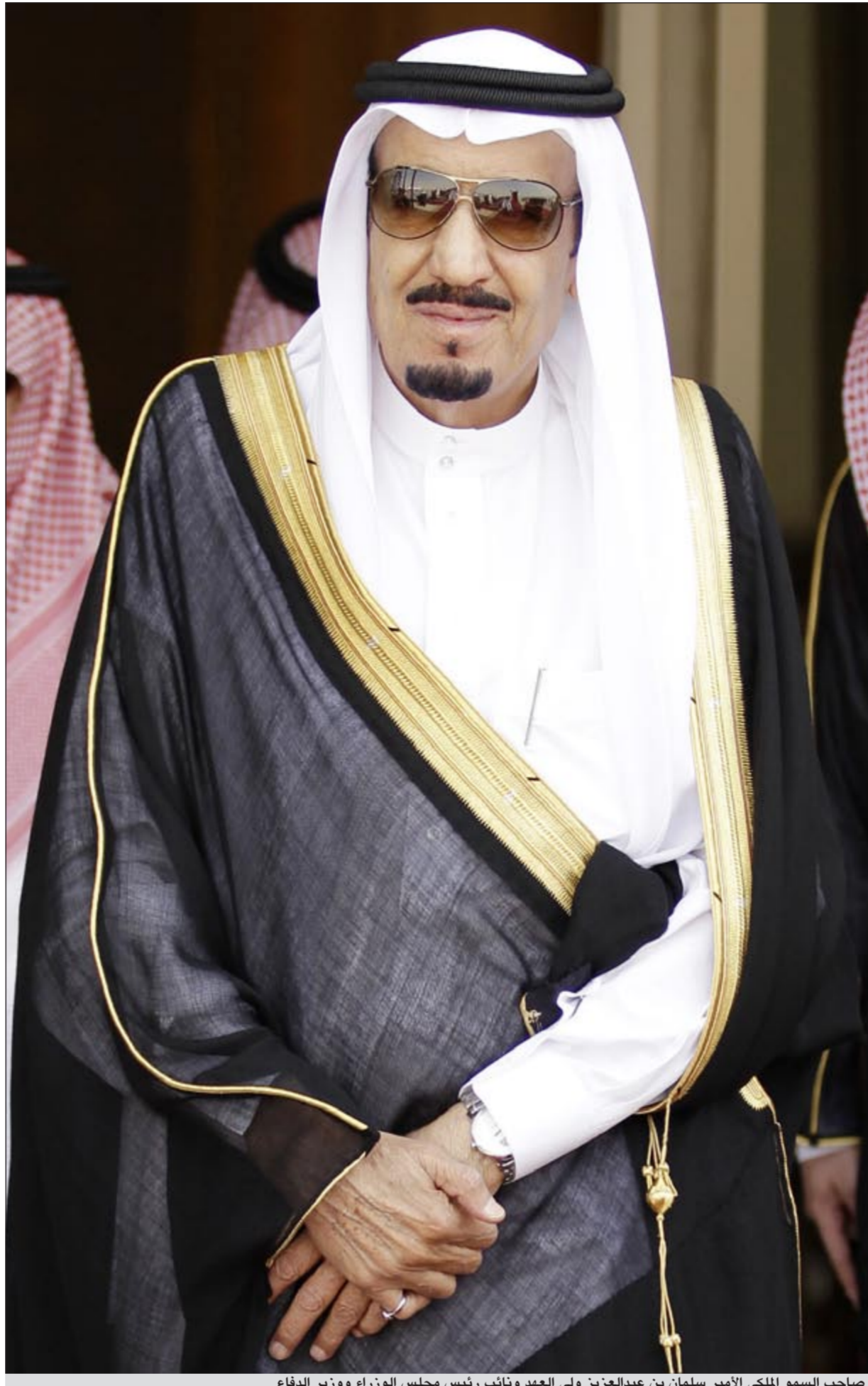
صاحب السمو الملكي الأمير سلمان بن عبدالعزيز ولي العهد ونائب رئيس مجلس الوزراء ووزير الدفاع

بها التاريخ له من خلال الادارة المتميزة والواضحة. وتقدم النائب شايح الشايح بتهنئة مماثلة لصاحب السمو الملكي الأمير سلمان بن عبدالعزيز على الثقة الغالية التي أولاها لسموه خادم الحرمين الشريفين الملك عبدالله بن عبدالعزيز باختياره ولياً للعهد وتعيينه نائباً لرئيس مجلس الوزراء ووزير الدفاع ونتمنى لسموه التوفيق لما فيه الخير والرفعة للمملكة العربية السعودية الشقيقة وان يستكمل مسيرة الخير، ونسال الله ان يديم على سموه موفور الصحة والعافية ودوام العافية.