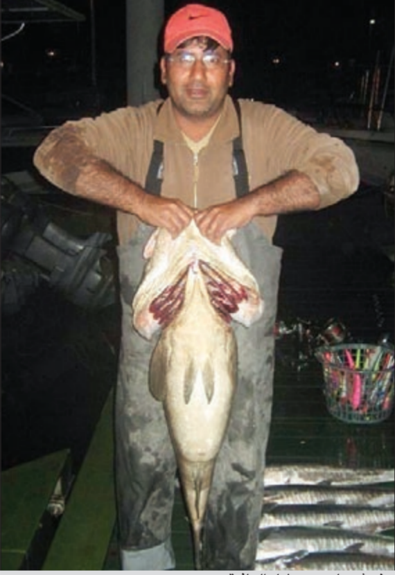
خوش هامور يعطيك العاقبة