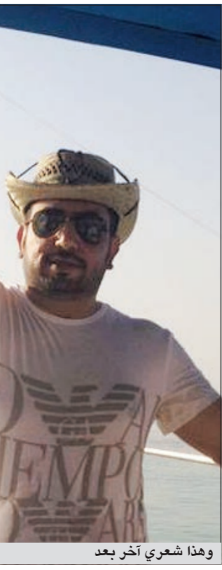
وهذا شعري آخر بعد