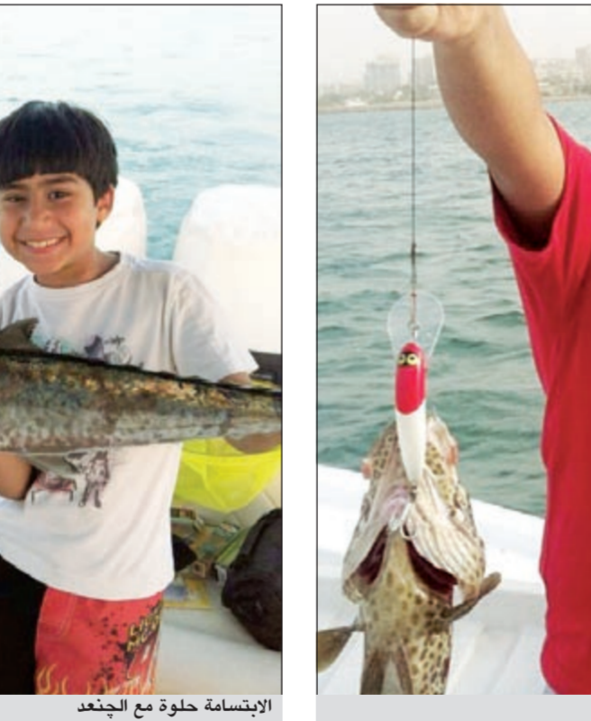
الابتسامه حلوة مع الجندع

تأندرا ما نسنع ان هناك بعض الحدائق يحبون الخروج للصيد وحدهم دون مرافق لهم فهل أنت من هذا النوع أم لك مرافقون لا تتخلى عنهم وهم يباليونك بالشعور