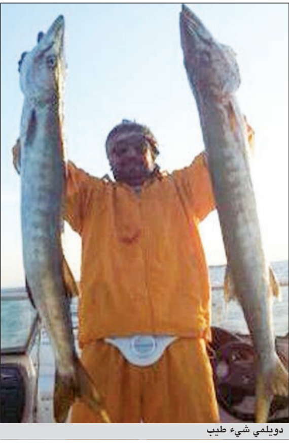
دويلمي شيء طيب