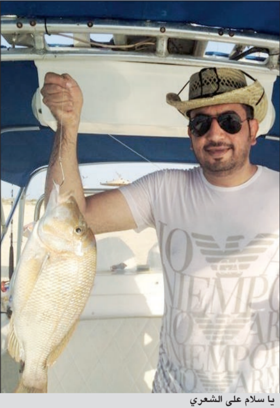
يا سلام على الشعري