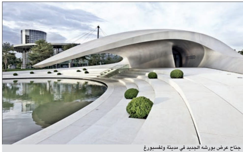
جنح عرض بورشه الجديد في مدينة ولفسبورغ

تجربة مبهرة مع بورشه تمتد على مساحة 1,400 متر مربع