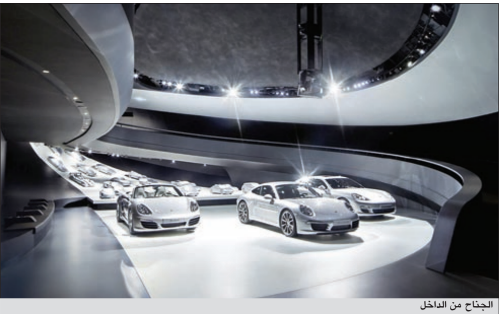
الجنح من الداخل