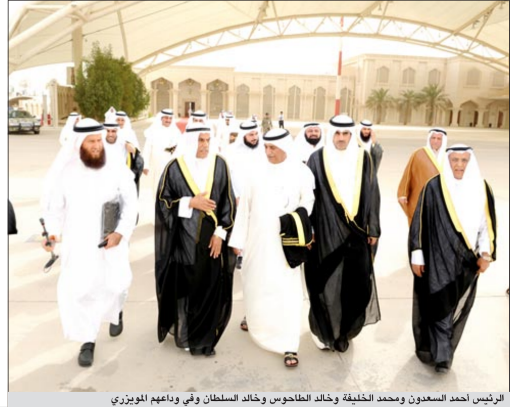
الرئيس أحمد السعدون ومحمد الخليفة وخالد الطحوس وخالد السلطان وفي وداعهم الموزيري

غادر البلاد ظهر امس رئيس مجلس الأمة أحمد السعدون ونائب رئيس مجلس الأمة خالد السلطان ومجموعة من الأعضاء ارض الوطن متوجهين الى المملكة العربية السعودية العزاء بوفاة المغفور له بإذن الله تعالى ولي العهد نائب رئيس مجلس الوزراء وزير الداخلية صاحب السمو الملكي الامير نايف بن عبدالعزيز آل سعود طيب الله ثراه. وكان في وداع الوفد وزير الدولة لشؤون مجلس الأمة ووزير الدولة لشؤون الاسكان شعيب الموزيري.