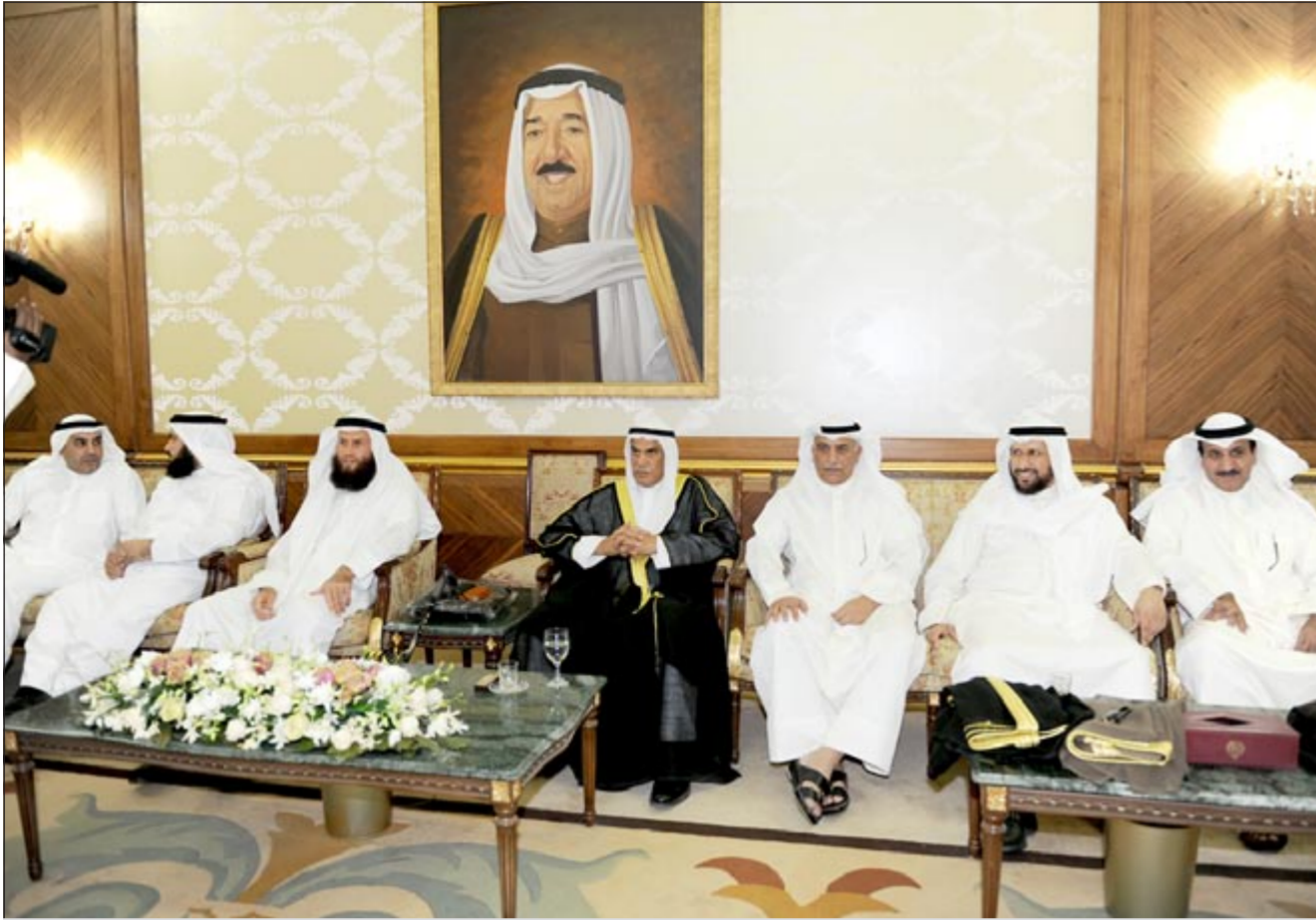
الرئيس أحمد السعدون متوسلاً خالد السلطان وشعيب الموزيري وعبدالله العيمري وسالم النعلان ود.جمعان الحريش ود. عبدالله الطريجي