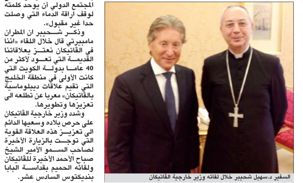
السفير د.سهيل شحير خلال لقائه وزير خارجية الفاتيكان

على تعزيز التعاون مع الفاتيكان وترحيبها بزيارة مسؤوليها إلى الكويت في أي وقت. وقال أنه استمع إلى وجهة نظر الفاتيكان الخاصة بالأوضاع والتطورات في المنطقة وبخاصة الوضع السياسي في سورية، حيث أكد وزير خارجية الفاتيكان بهذا الصدد أنه يتعين «على المجتمع الدولي أن يوحد كلمته لوقف اراقة الدماء التي وصلت حداً غير مقبول».