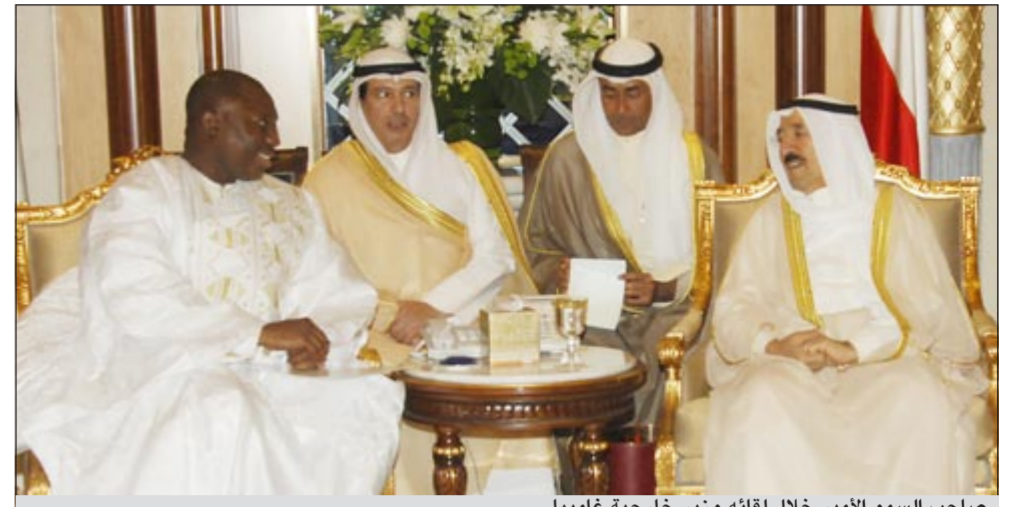
صاحب السمو الأمير خلال لقائه وزير خارجية غامبيا