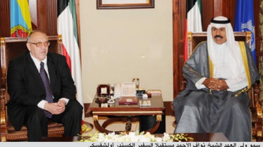
سمو ولي العهد الشيخ نواف الأحمد مستقبلاً السفير الكسندر أولشفسكي

استقبل سمو ولي العهد الشيخ نواف الأحمد بقصر بيان أمس سفير جمهورية بلغاريا لدى الكويت السفير الكسندر بوريوسوف أولشفسكي وذلك بمناسبة توليه مهام منصبه الجديد