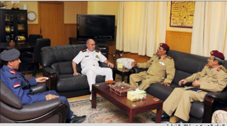
الوفد العسكري خلال الزيارة

قام وفد عسكري من جمهورية اليمن بزيارة كلية مبارك العبدالله للقيادة والأركان في رئاسة الأركان العامة للجيش، وذلك ضمن الزيارة التي يقوم بها الوفد للكويت، ويرأس الوفد مدير كلية القيادة والأركان في جمهورية اليمن العميد الركن عمر سالم بارشيد وذلك من المقرر ان تقام جميعها في مدينة نبي بدولة الامارات العربية المتحدة مع نهاية العام الحالي 2012.