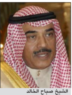
الشيخ صباح الخالد

تلقى نائب رئيس مجلس الوزراء ووزير الخارجية ووزير الدولة لشؤون مجلس الوزراء الشيخ صباح الخالد رسائل خطية من نظرائه وزراء الخارجية في قطر والإمارات والبحرين والقمر والمالديف. وتلقى الشيخ صباح الخالد رسالة من رئيس مجلس الوزراء ووزير الخارجية ووزير الدولة لشؤون مجلس الوزراء الشيخ صباح الخالد رسالة مماثلة من وزير خارجية جمهورية المالديف د.علي أكبر صالحى تتعلق بالعلاقات الثنائية بين البلدين وبحث سبل تطويرها. كما تلقى الشيخ صباح الخالد رسالة مماثلة من وزير خارجية جمهورية المالديف د.عبدالصمد عبدالله. إلى ذلك، استقبل نائب رئيس مجلس الوزراء ووزير الخارجية ووزير الدولة لشؤون مجلس الوزراء الشيخ صباح الخالد في قصر بيان صباح أمس وزير خارجية غامبيا مامبوري أنجاي والوفد المرافق له وذلك بمناسبة زيارته الرسمية للبلاد. وتم خلال اللقاء بحث العلاقات بين البلدين الصديقين والقضايا ذات الاهتمام المشترك