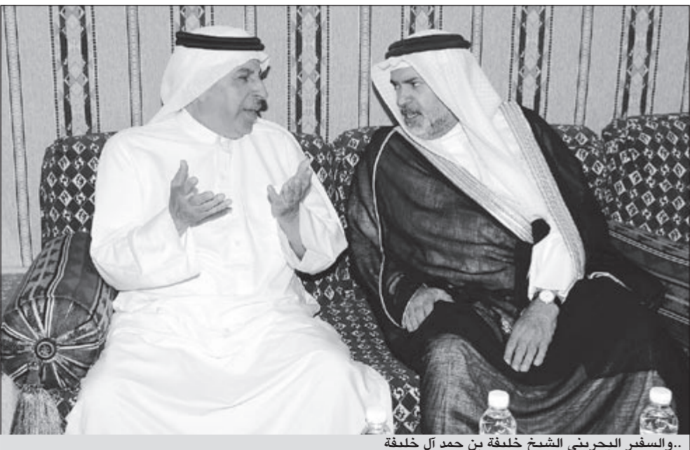
..والسفير البحريني الشيخ خليفة بن حمد آل خليفة

كما استقبل السفير جموعاً من الإعلاميين ورجال الأعمال والوجهاء الكويتيين والمواطنين السعوديين المقيمين في الكويت والذين أشادوا بمناقب الفقيد الكبير ودعوا له بالرحمة والمغفرة وإن يسكنه فسيح