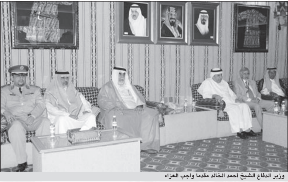
وزير الدفاع الشيخ أحمد الخالد مقدا واجب العزاء