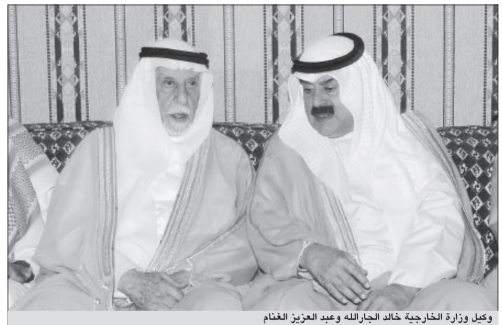
وكيل وزارة الخارجية خالد الجارالله وعبد العزيز الغنم