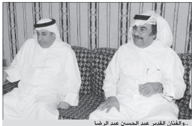
..والغنان القدير عبد الحسين عبد الرضا