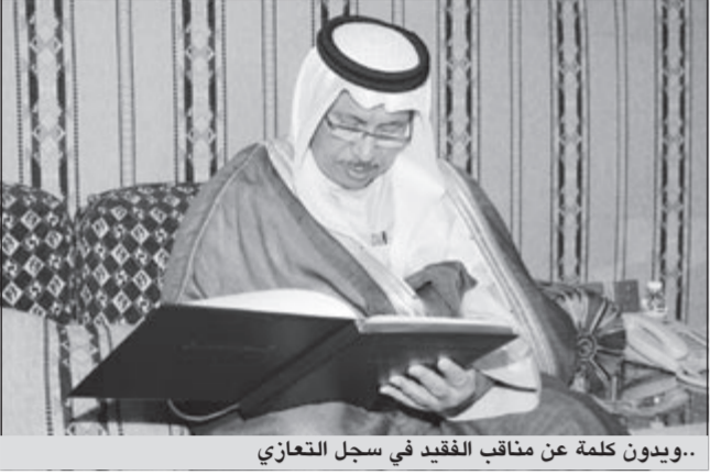
..ويؤن كلمة عن مناقب الفقيد في سجل التعازي