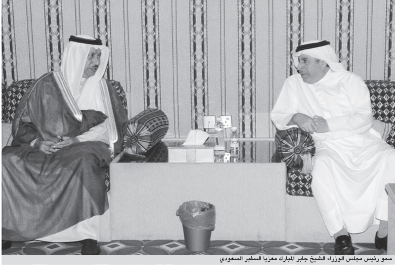
سمو رئيس مجلس الوزراء الشيخ جابر المبارك معزيا السفير السعودي