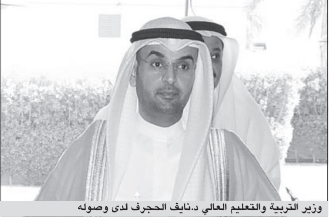
وزير التربية والتعليم العالي د.نايف الحجرف لدى وصوله