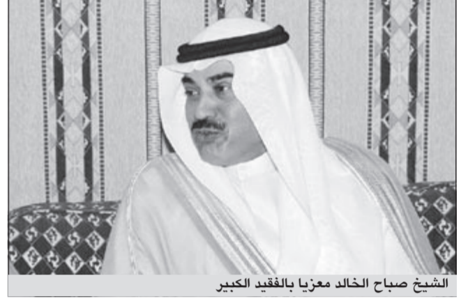
الشيخ صباح الخالد معزيا بالفقيد الكبير