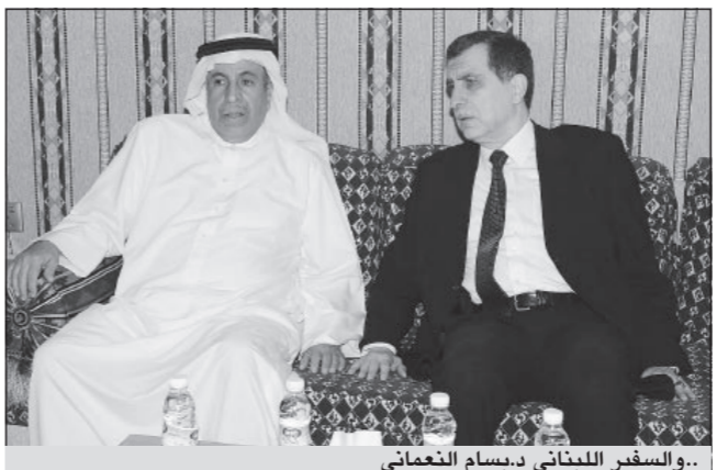
..والسفير اللبناني د.بسام النعماني