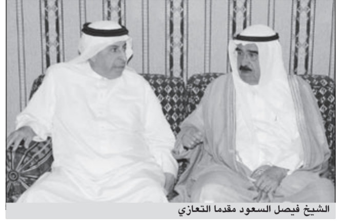
الشيخ فيصل السعود مقدا التعازي