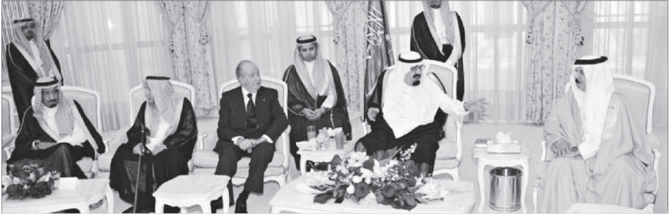
خادم الحرمين الشريفين الملك عبدالله بن عبدالعزيز وولي العهد وزير الدفاع الأمير سلمان بن عبدالعزيز يستقبلان ملك البحرين الشيخ حمد بن عيسى وملك إسبانيا خوان كارلوس للتعزية بالأمير نايف بن عبدالعزيز