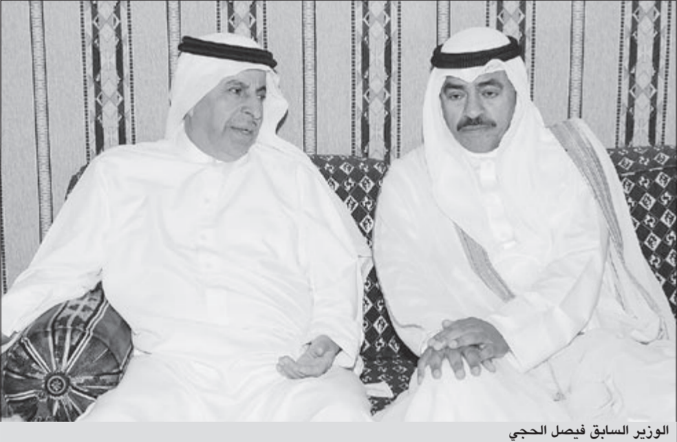
الوزير السابق فيصل الحجري