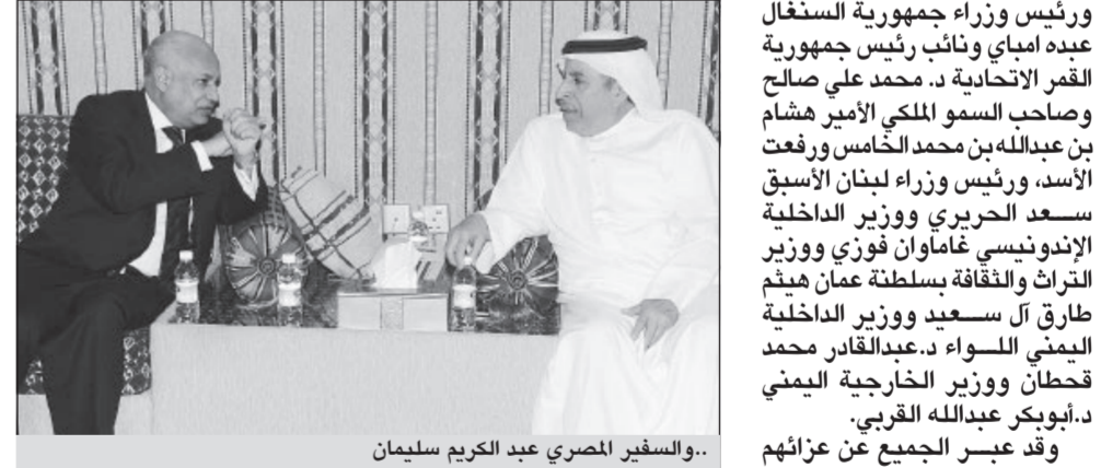
..والسفير المصري عبد الكريم سليمان

أحمد عبدالعزيز قطان سفير المملكة العربية السعودية بالقاهرة و«عبد القوي خليفة محافظ القاهرة وعدد كبير من كبار العلماء والدعاة وقيادات الأوقاف صلاة الغائب أسس على روح فقيد الأمة الإسلامية المغفور له نايف بن عبدالعزيز ولي عهد المملكة العربية السعودية عقب صلاة الظهر بمسجد الأزهر الشريف، وأعرب وزير الأوقاف عن خالص تعازيه لخادم الحرمين الشريفين والشعب السعودي الشقيق والأمة الإسلامية في وفاة المغفور له، داعياً الله أن يتغمده برحمته ويسكنه فسيح جناته.