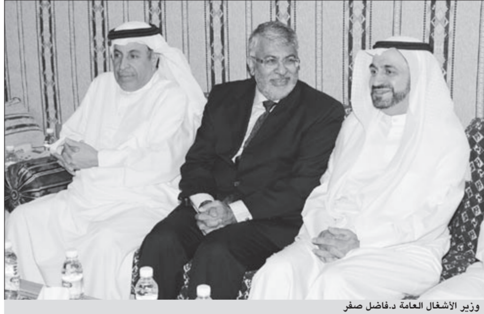
وزير الأشغال العامة د.فاضل صفر