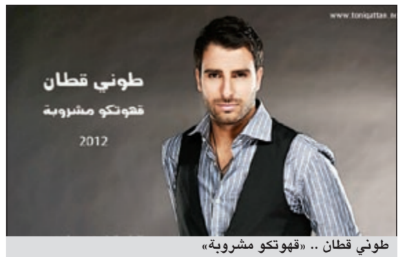
طوني قطان .. «قهوتكو مشروبة»

طرح النجم الشاب طوني قطان أغنيته الجديدة «قهوتكو مشروبة» في الأسواق، والأغنية من كلمات والحان وتوزيع علي خير. ويقول قطان في مطلعها: «قهوتكو مشروبة.. وما يروح بيكو خايب.. والبيت المظلم.. صارت ملك النسايب.. والبيت صارت الكو.. والحاضر يعلم الغايب.. ويقول الله حيكو.. زغرودة تملأ تمكو»، وتعتبر الأغنية الجديدة للنجم الشاب ثالث إنتاجاته في عام 2012 بعد نجاح أغنيته «أفا» و«عالمود» التي قام بإنتاج الأخيرة شركة بي سيل لخدمات المحمول. ويواصل طوني، بحسب موقع «الصنارة»، التحضير لألبومه الجديد الذي يتضمن 10 أغاني تتعاون من خلاله مع عدد كبير من الشعراء والملحنين والموزعين منهم: عمر ساري، بلال المصري، هيثم عوار، حازم منسي، علي خير بالإضافة إلى وائل الشراوي.