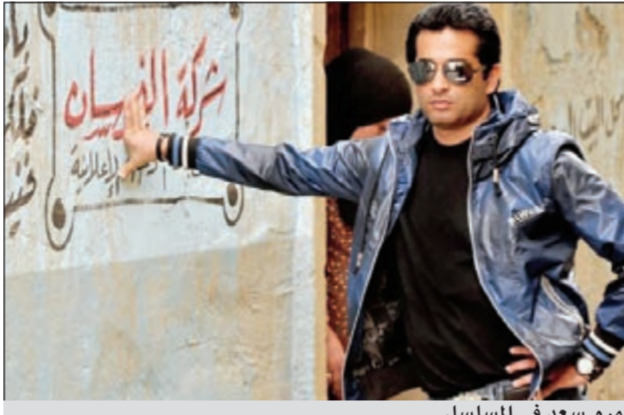
عمرو سعد في المسلسل

استعان المخرج إبراهيم فخر أثناء تصويره لأحد مشاهد مسلسل «خرم إبرة» بعدد 300 كومبارس و100 سيارة ما بين ملاكي وأجرة ونصف نقل، وذلك لكي يصور أحد مشاهد المسلسل بين الفنان عمرو سعد والفنان إدوارد وهما يجتازان عن شخص تعرض لحادث سيارة منذ خمس سنوات لكن دون فائدة. وقد تم تصوير المشهد في شارع عماد الدين بمدينة الإنتاج الإعلامي واستغرق تصويره ثلاث ساعات كاملة، ومن المقرر أن يستأنف فخر، بحسب موقع «السينما دوت كوم»،