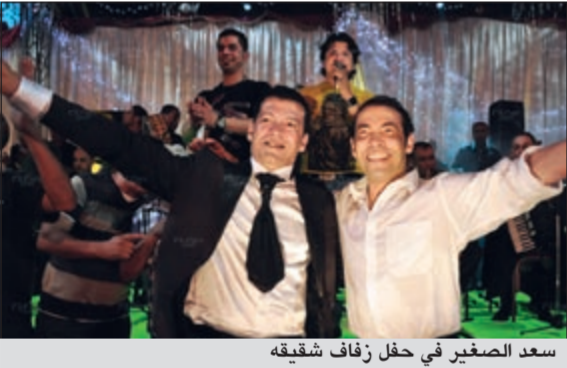
سعد الصغير في حفل زفاف شقيقه

احتفل الفنان سعد الصغير بزفاف شقيقه ناجي داخل نادي «أسكو» في منطقة شبرا، وحضر الحفل، بحسب موقع «النشرة»، مجموعة كبيرة من الفنانين منهم حمادة هلال، وفاء عامر، وطلعت زكريا وأسترته، ومحمد لطفي، وأبو الريش، ومئة فضالي، وأميرة نور، والطفلة جنى، وحسن عبدالفتاح، وساندي، وأمينة، وهدي، ودياب، وسما المصري، ومها أحمد، وحجازي متقال، وطارق الشيخ. وغنى سعد مجموعة من أغنياته الشهيرة وسط فرقة الموسيقي التي أشعلت حفل الزفاف ورقص، وقدم مجموعة من الديوهات الغنائية مع عدد من الفنانين الشعبيين.