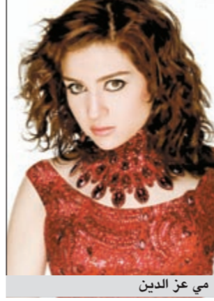
مي عز الدين

قربت الفنانة مي عز الدين خوض تجربة تقديم البرامج بقايا الفنانين لكن بشكل مختلف. إذ تعاقدت مع إحدى القنوات لتقديم برامج للأطفال خلال شهر رمضان المقبل. وكشفت النجمة المصرية، بحسب موقع «أنا زهرة»، أنها تلقت الكثير من العروض لتقديم البرامج لكنها كانت ترفض كونها غير مناسبة إلى أن عرض عليها تقديم برامج للأطفال، فوافقت على الفور خصوصا أنها تعشق الأطفال، وافضة الكشف عن اسم الفضائيه التي تعاقدت معها، استنتج في الفترة المقبلة. يذكر أنه كان يفترض أن تخوض مي تجربة تقديم البرامج خلال رمضان الماضي، لكنها اعتذرت لفتاة «النهار» التي تقاوضت معها لتقديم برنامج للأطفال بحجة انشغالها بتصوير مسلسل «أمم» الذي شاركت في بطولته مع تامر حسني.