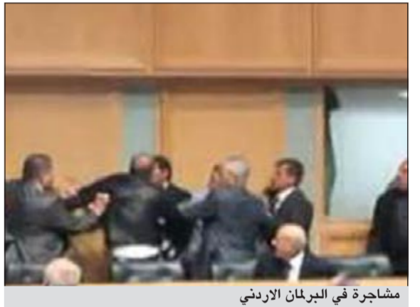
مشاجرة في البرلمان الأردني

عقان - أ.ش.: نشب شجار بين عضوين من مجلس النواب الأردني قبل بدء الجلسة التي عقدها المجلس صباح أمس لمناقشة مشروع قانون الانتخاب حيث حاول أحد النواب قذف زميل له بالأحذية احتجاجا على انتقاد الأخير لخرجات اللجنة القانونية بالمجلس لمشروع القانون.