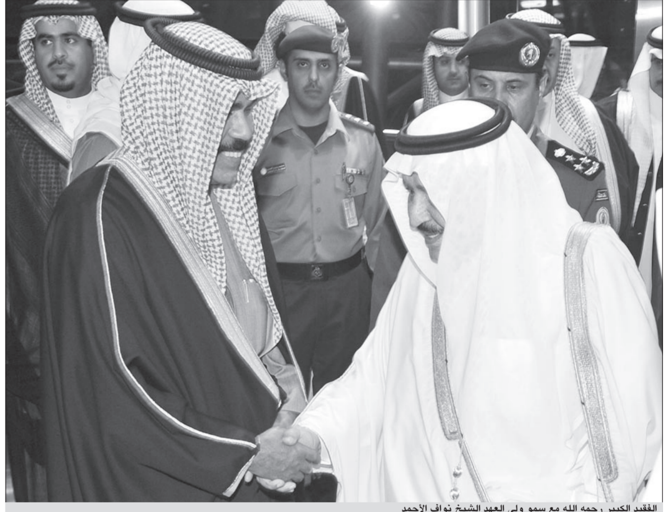
الفقيه الكبير رحمه الله مع سمو ولي العهد الشيخ نواف الأحمد

فحسب، بل جعلتها وكأنها حكومة مقاومة من داخل الحدود الكويتية ودعمتها في موقفها اللوجستي بدعم قيمة الدينار الكويتي فلم تسمح المملكة له بتراجع قيمته.