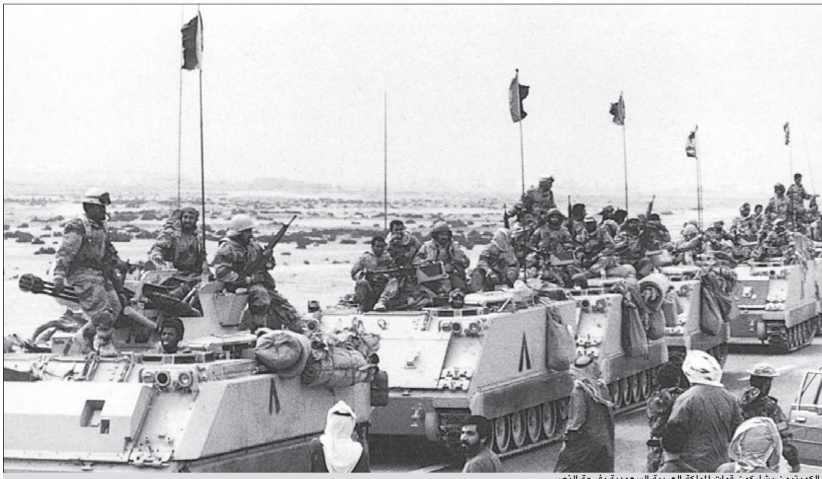
الكويتيين يشاركون قوات المملكة العربية السعودية بفرحة النصر