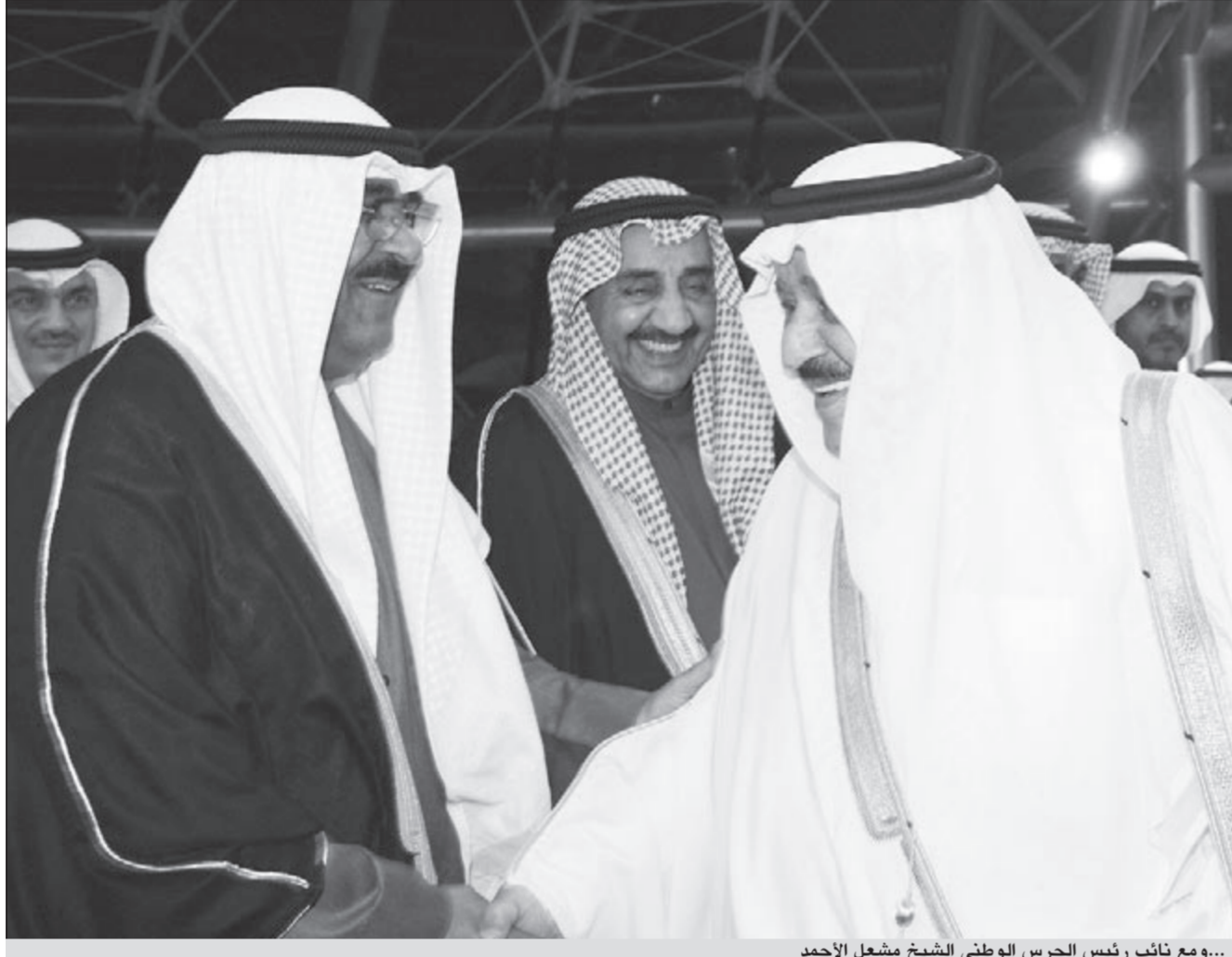
...ومع نائب رئيس الحرس الوطني الشيخ مشعل الأحمد