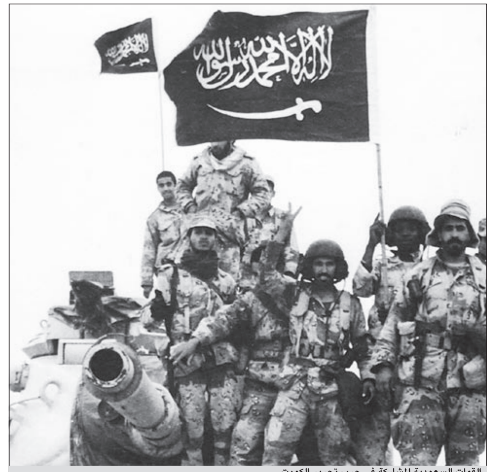
القوات السعودية المشاركة في حرب تحرير الكويت