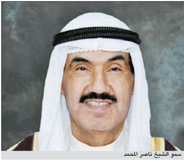
سمو الشيخ ناصر المحمد

(سبتمبر - يونيو)، وخلال فترة العام الدراسي ترغمهم على حل واجباتهم بمفردهم بالفصل حتى تواصل احاديثها وتصفحها عبر الانترنت. هل من المنطق والعقل ان هناك طفلا في عمر التاسعة يملك القدرة البدوية الكتابية ليصل الى 100 مرة عقوبة على لا شيء سوى انها تريد ان تقضي وقتها عبر الـ «Chat».