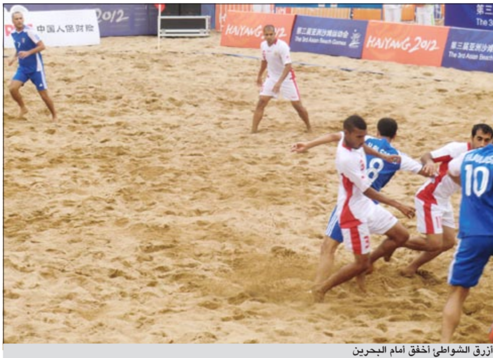
أزرق الشواطئ أخفق أمام البحرين