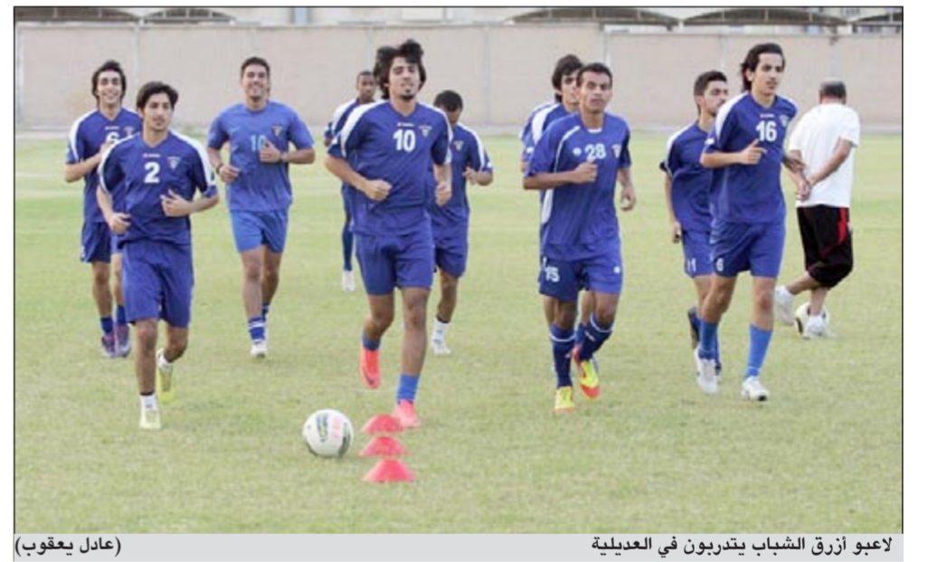
لاعبو أزرق الشباب يتدربون في العديلية