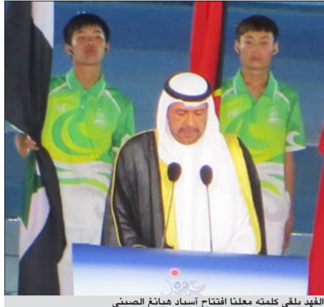
الفهد يلقي كلمته معلنا افتتاح آسياد هيانغ الصيني