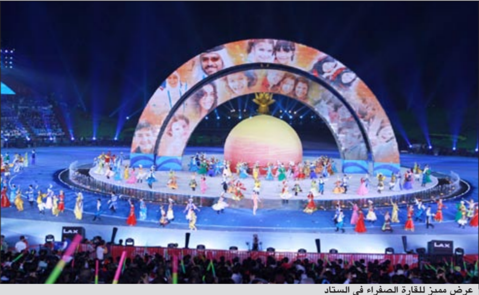
عرض مميز للقارة الصفراء في استاد