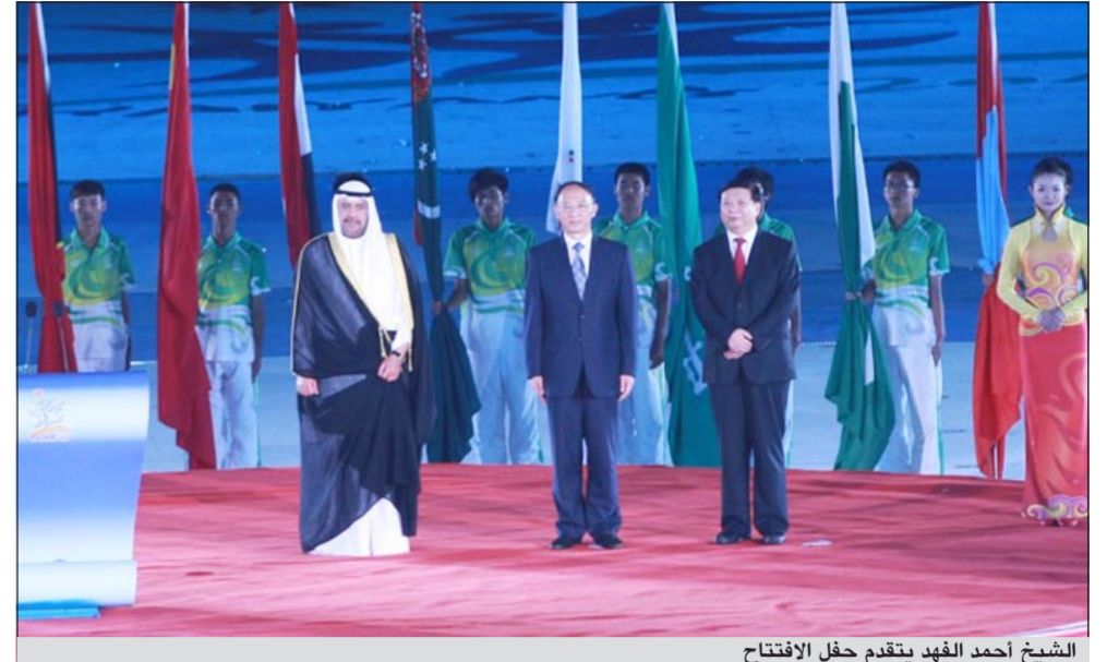
الشيخ أحمد الفهد يتقدم حفل الافتتاح

«أزرق الشواطئ» يودّع.. واليد يتصدر ويلتقي أفغانستان والبحرين