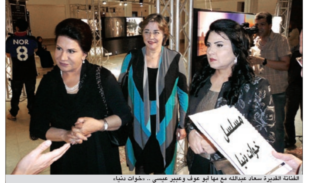
الفنانة القديرة سعاد عبدالله مع مها ابو عوف وعبير عيسى.. «خوات دنيا»