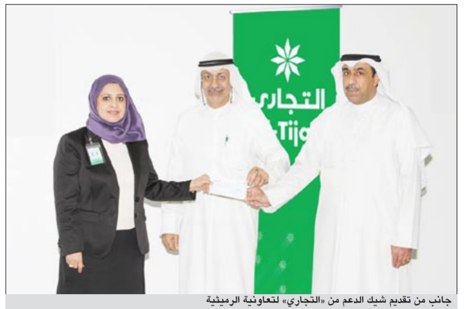
جانب من تقديم شيك الدعم من «التجاري» لتعاونية الرميثة

قدم البنك التجاري الكويتي مبلغاً مالياً لجمعية الرميثة التعاونية كمساهمة حصرية من قبل البنك لتحسين وتطوير مضمار المشي الذي يخدم قاطني منطقة الرميثة والمناطق المجاورة، وذلك في إطار جهود البنك المتواصلة الرامية إلى تقديم الدعم والرعاية لمؤسسات المجتمع المدني التي عادة ما تقوم على خدمة أفراد المجتمع كافة.