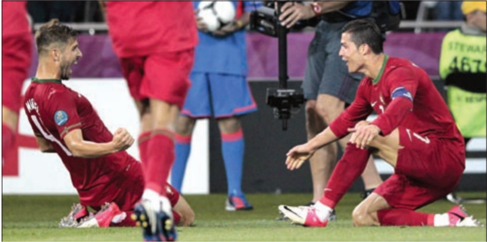
رونالدو يحتفل بهدفه الثاني بمرمي هولندا

ولم يكن المنتخب الدنماركي افضل حالا من بقية منتخبات المجموعة، وتلقى خسارة «منطقية» أمام ألمانيا 1-2 في اللقاء الذي اقيم على استاد أرينا، وانتهى الشوط الاول بالتعادل الإيجابي بهدف لكل منهما، سجل لوكاس بودولسكي هدف السبق لألمانيا (19)، قبل أن يحرز مايكل كرون ديلي هدف التعادل للدنمارك (24). واستطاع لارس بيندر تسجيل هدف الفوز لألمانيا في الدقيقة (80)، ليحصد بذلك الألمان العلامة الكاملة في دوري المجموعات.