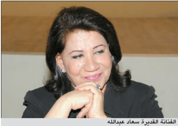
الفنانة القديرة سعاد عبدالله