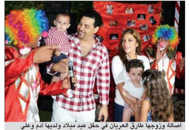
أصالة وزوجها طارق العريان في حفل عيد ميلاد ولديها آدم وعلي

نشرت الفنانة أصالة على صفحتها الخاصة على موقع التواصل الاجتماعي «فيسبوك» الجمعة الماضية مجموعة من صور حفل عيد ميلاد توأمها آدم وعلي، وأقيم الحفل، بحسب ما ذكر موقع «النشرة»، داخل فيلا أصالة وزوجها طارق العريان بحضور والدتها وشقيقها وشقيقته وابنتها شام من زوجها الأول، كما حضر الحفل شقيقة طارق والفنان رامي صبري وزوجته.