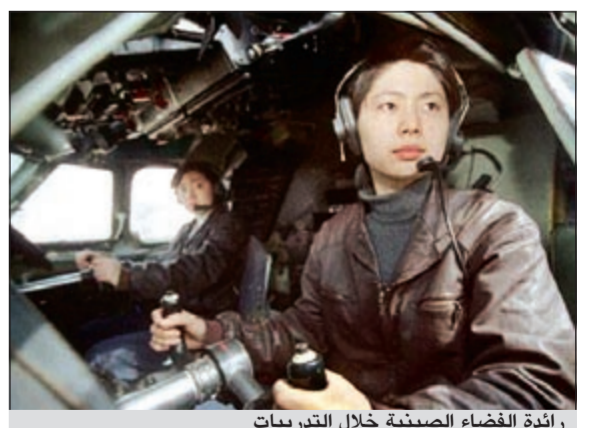
رائدة الفضاء الصينية خلال التدريبات

طوكيو - كونا: تستعد الصين لإطلاق أول رائدة فضاء وذلك برفقة رائدي فضاء رجال اليوم في أول مهمة لسفينة فضاء ماهولة بحسب ما ذكرت وكالة أنباء الصين الجديدة (شينخوا). وستنطلق المركبة الفضائية المأهولة «شنتشو 9» وعلى متنها رائدة الفضاء الصينية ليو يانغ البالغة 33 عاماً ورائدة الفضاء جينغ هاي بينغ وليو وانغ لتحقيق مهمة الالتحام الفضائي المأهول الأولى في تاريخ الصين مع وحدة المختبر الفضائي «تيانغوانغ-1» التي تم تجهيزها بالمدار المحدد لتنفيذ عملية الالتحام، وسيبدأ تزويد الوقود للصاروخ الحامل «لونج مار تشن - 2 أف» المطور بعد ظهر أمس الجمعة. وقالت هيئة برنامج الالتحام الفضائي المأهول الصينية إن ميدان الإطلاق وجميع أنظمة التحكم جاهزة كما أن رواد الفضاء في وضع مستقر وجيد ومنتاهبون للرحلة الفضائية.