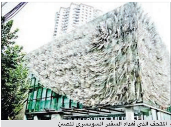
المتحف الذي أهداه السفير السويسري للصين