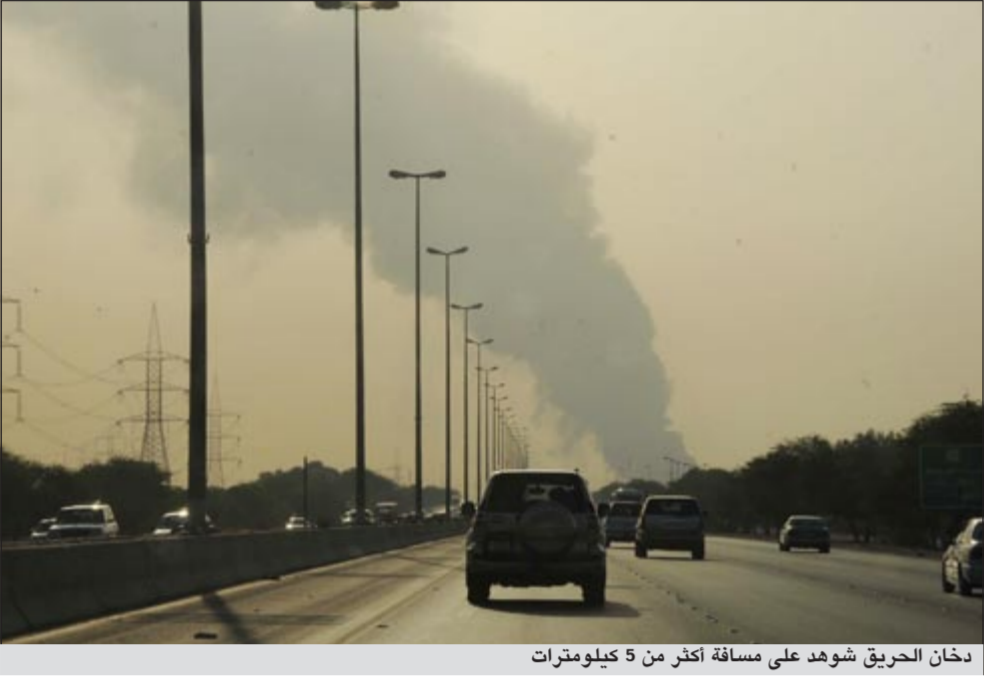
دخان الحريق شوهد على مسافة أكثر من 5 كيلومترات