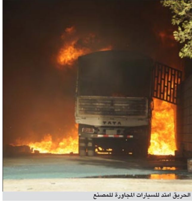
الحريق امتد للسيارات المجاورة للمصنع