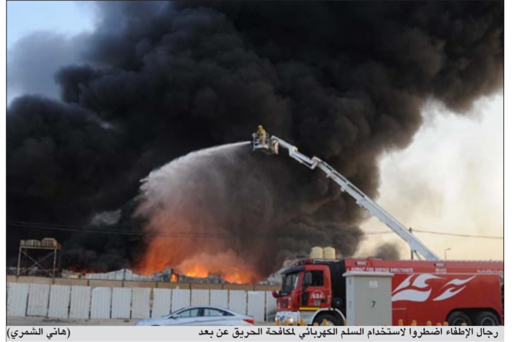
رجال الإطفاء اضطروا لاستخدام السلم الكهربائي لمكافحة الحريق عن بعد (هاني الشمري)

ان الحريق الأخير الذي اندلع امس والحريق الذي سبقه في قسائم امغرة يوم الاربعاء الماضي كان يستهدف قسائم صناعية تحوي مسود كيميائية خطيرة للغاية، ولولا سرعة تدخل رجال الإطفاء للحيلولة دون وصول النيران لتلك المخازن لحصلت كارثة حقيقية، حيث ان انفجار مثل تلك المواد لا يقل خطورة عن انفجار القنابل، وان من شأن حادثة كهذه ان توقع ضحايا عدة وليس بين رجال الإطفاء فقط بل حتى بين سكان مدينة سعد العبدالله القريبين من تلك القسائم.