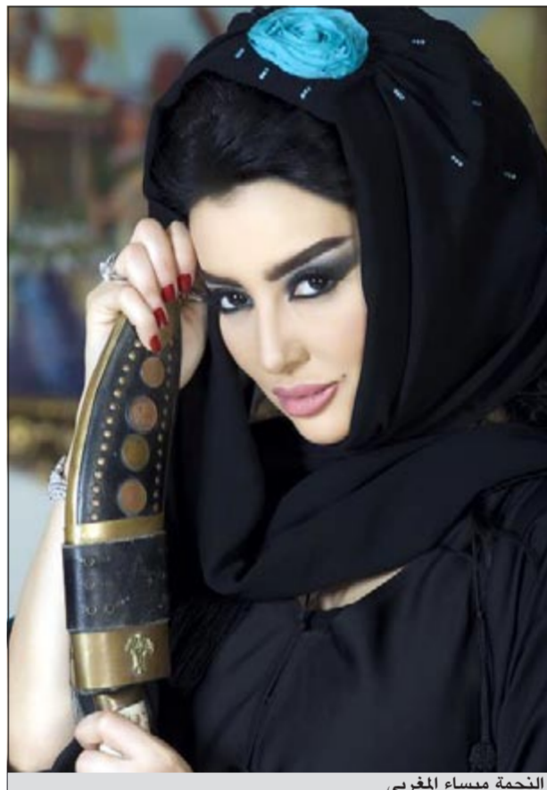
النجمة ميساء المغربي

أكدت النجمة ميساء المغربي لـ «الأنباء» أن شخصية «الجوهرة» ستكون غائبة في الجزء الرابع من المسلسل الخليجي «هوامير الصحراء» نافية بذلك تجسيد الفنانة أمل العوضي دورها في هذا الجزء.