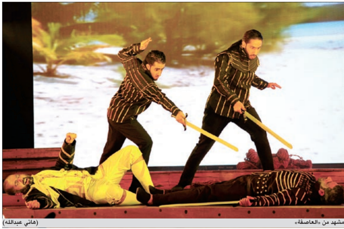
مشهد من «عاصفة»