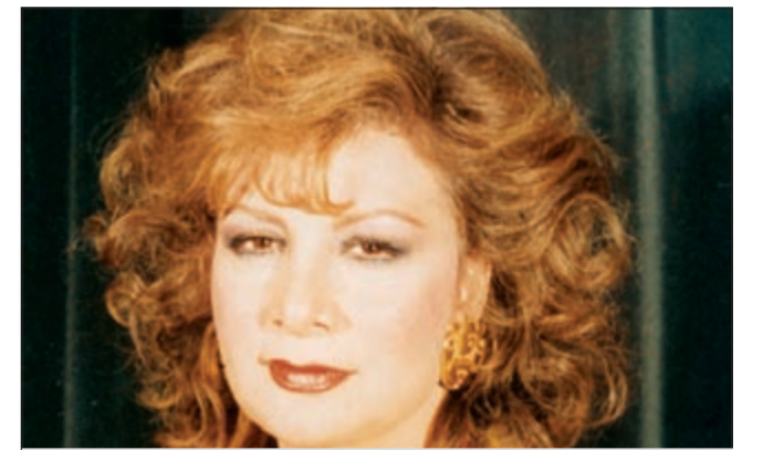
الرحلة الإعلامية فريال صالح

القاهرة - أ.ش. غيب الموت اول من امس الاعلامية الشهيرة فريال صالح عن عمر يناهز 71 عاما بعد صراع طويل مع المرض. وتوفيت الإعلامية فريال صالح التي كانت تقدم البرنامج الشهير «اخترنا لك» صباح اليوم بأحد المستشفيات. وكانت فريال صالح من الاعلاميات الرائدات في التلفزيون ماسيرو وقدمت عددا من البرامج المهمة في مجالات المنوعات ومن أشهر برامجها «اخترنا لك» و«حق الجماهير».