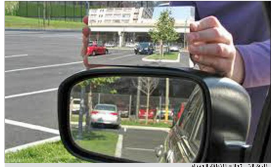
المرآة التي تعالج المنطقة العمياء

أم.بي.سي: مرآة تتيح رؤية جيدة للمنطقة العمياء التي لا يستطيع السائق رؤيتها أثناء القيادة، ابتكار جديد طوره أستاذ الرياضيات بجامعة دريكسل الأمريكية «أندرو هيكس» حيث تتيح المرآة الجديدة مجالاً أوسع للرؤية، وتأتي متجنبة بمهارة عالية. إشكالية المنطقة العمياء تعود إلى طبيعة تصميم المرايا الجانبية المستخدمة حالياً، التي لا تتيح رؤية أوسع للمنطقة المجاورة والخلفية للسيارة بما لا يزيد على 17 درجة لزاوية المرآة، ما يتسبب أحياناً في وقوع بعض الحوادث المرورية. المعادلة التي استخدمها هيكس ساعدته في ابتكار المرآة التي تميزت بزواوية انحناء