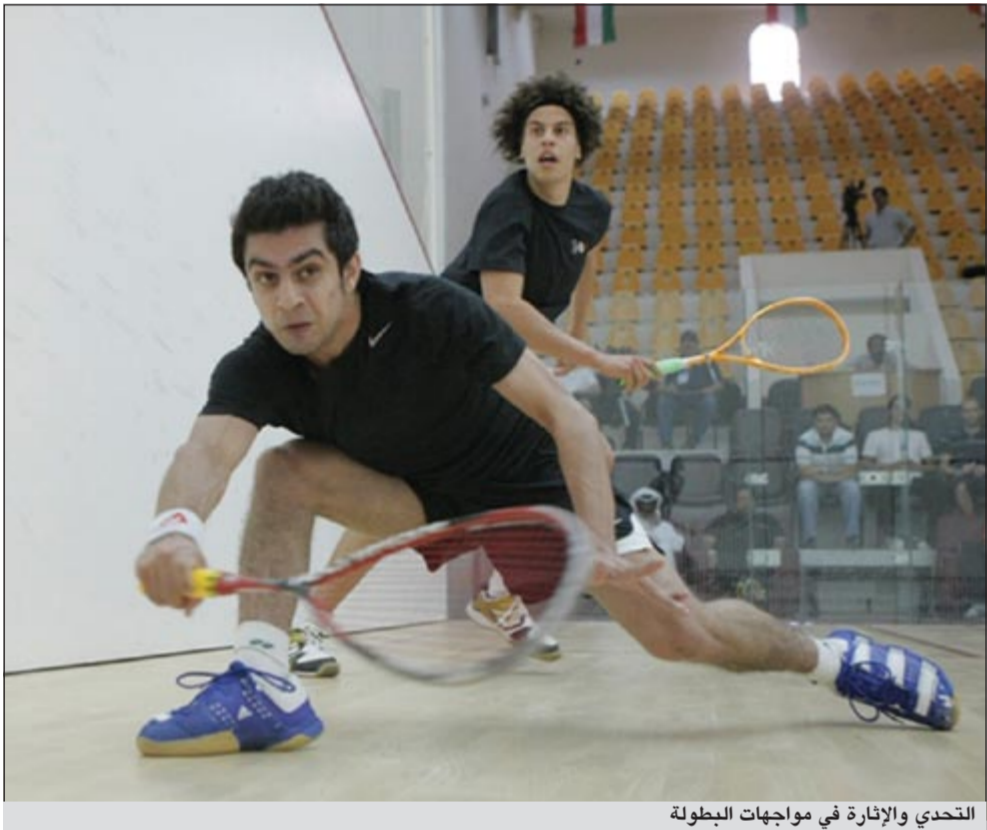
التحدي والإثارة في مواجهات البطولة