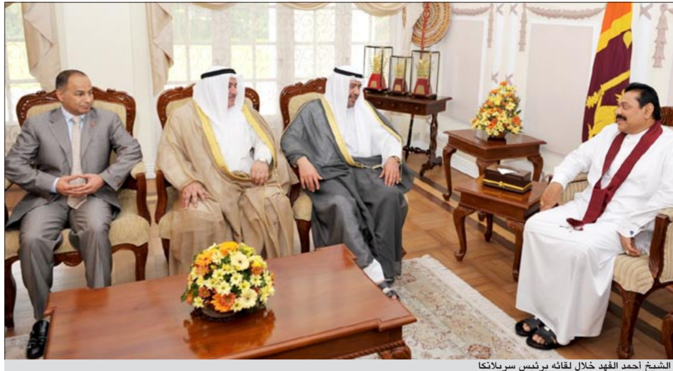
الشيخ أحمد الفهد خلال لقائه برئيس سريلانكا

لصاحب السمو الأمير وإلى الحكومة والشعب الكويتي، متمنيا للكويت وشعبها دوام الرخاء والاستقرار في ظل القيادة الحكيمة لصاحب السمو الأمير. كما أثنى راجاباسكا على التعاون القائم بين بلاده والمجلس الأولمبي الآسيوي على مختلف الأصعدة الفنية والإدارية لخدمة قطاعي الشباب والرياضة في سريلانكا آملا تعزيز هذا التعاون البناء بين بلاده والمجلس الأولمبي الآسيوي وكذلك مع اتحاد اللجان الأولمبية الوطنية (انوك). واستعرض الرئيس السريلاكي الاهتمام الذي توليه بلاده لقطاعي الشباب والرياضة وحرصه الدائم على جميع متطلبات الشباب الرياضي، مشيرا إلى شروع بلاده في إنشاء 26 منشأة رياضية تغطي معظم احتياجات الشباب السريلاكي. وأبدى رغبة بلاده في استضافة دورة الألعاب الآسيوية