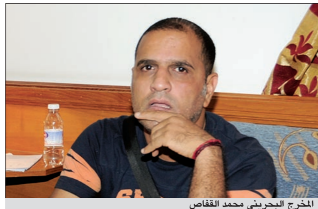
المخرج البحريني محمد القفاص

صرح الممثل كريم عبدالعزيز بأنه سيستعين بأغنية الفنان محمد منير «يا اهل العرب والطرب» لتكون أغنية التتر لمسلسله الجديد «الهروب». ويأتي ذلك بعد أن كان مقررا أن يقوم منير بغناء أغنية خاصة لتتر المسلسل ولكن منير رفض هذا الأمر بعد أن كان قد شرع في التفكير لغناء تتر المسلسل مما اضطر فريق المسلسل، بحسب موقع «النشرة»، للاستعانة بأغنيته «يا اهل العرب والطرب» لتكون أغنية التتر للمسلسل. يذكر أن مسلسل «الهروب» من تأليف السيناتور ست بلال فضل ومن إخراج محمد علي وينتج صفوت غطاس، ومن المقرر عرضه في شهر رمضان المقبل.