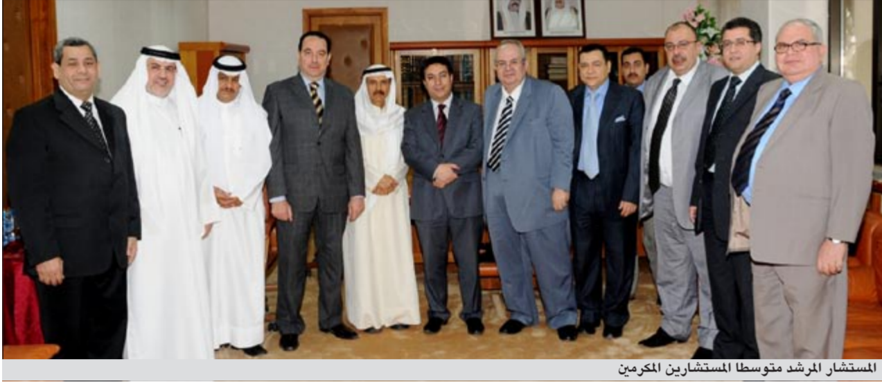
المستشار المرشد متوسط المستشارين المصريين

شامخا، مؤكداً متانة الروابط القوية والأخوية بين أعضاء السلطة القضائية في البلدين الشقيقين الكويت ونظيرتها في جمهورية مصر العربية.