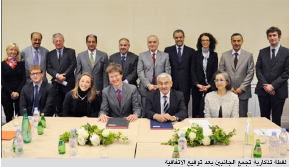
لقطة تذكارية تجمع الجانبين بعد توقيع الاتفاقية

وفي مستويات أكاديمية مختلفة لدى جامعة «سائينسز بو» لفترة محدودة وعلى أسس تنافسية. ومن المقرر أن ينظم البرنامج مؤتمراً علمياً على مدى السنوات الخمس المقبلة يتم من خلالها استعراض مخرجات البرنامج وطرح موضوعات ذات أولوية على مسطحات البحث من خلال اشراك كل ذوي العلاقة والاهتمام