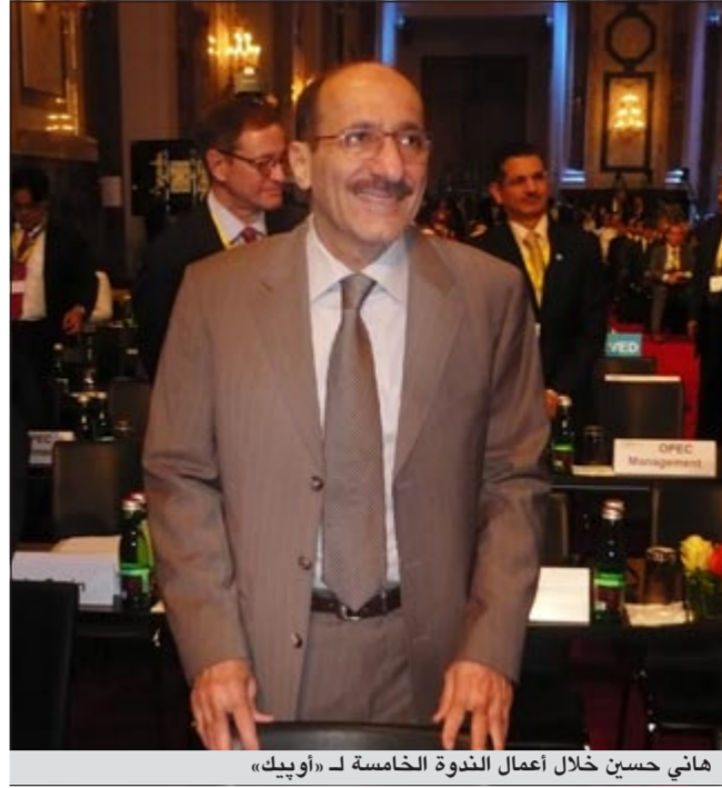
هاني حسين خلال أعمال الندوة الخامسة لـ «أوبك»

ورأى الوزير حسين ان هناك عدة عوامل تتحكم في السوق بينها العوامل الجيوسياسية والنفسية والمناخية إضافة الى معدلات المخزون الاستراتيجي للدول وهي كلها عوامل تؤثر على الاسعار وعلى السوق بصورة مختلفة داعياً في الوقت نفسه الى ضرورة التريث ودراسة جميع معطيات السوق المستقبلية وعدم اتخاذ القرارات بشكل متسرع وبما يضمن