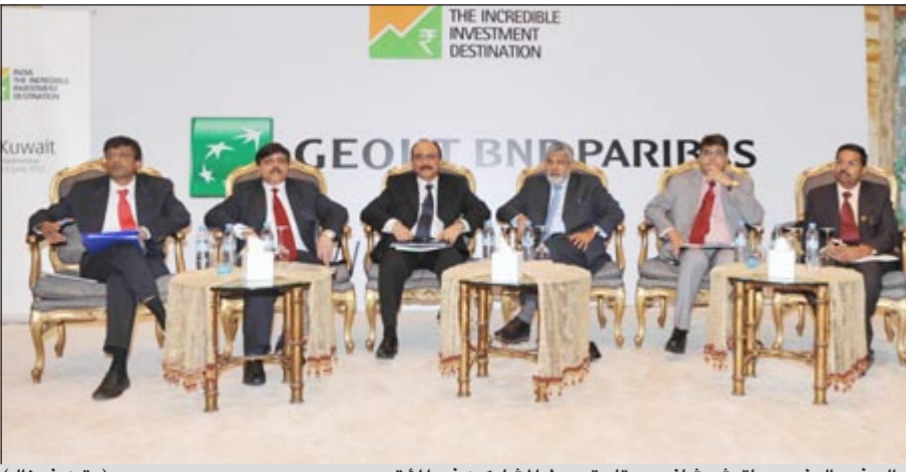
السفير الهندي ساتيش شانده ميها يتوسط المشاركين في المؤتمر (متمن غوزال)

فئة المستثمرين في الكويت الذين لهم علاقات اقتصادية طويلة مع الهند. من جانبه استعرض ممثل عن وزير المالية الهندي والوكيل المشارك لشؤون أسواق رأس المال وإدارة الشؤون الاقتصادية د. توماس مانويو أن الهند تساهم بنسبة 6% في إجمالي الناتج العالمي وتعد ثاني أسرع نمو بعد الصين بين اقتصاديات العالم الرئيسية.