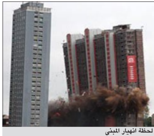
لحظة انهيار المبنى

وكالات: في 5 ثوان فقط انهار المبنى الأطول في أوروبا بمدينة جلاسكو في اسكتلندا، وصار جبلا من الأنقاض المكونة من الحديد الصلب والكتل الخرسانية، بعدما كان البناية السكنية الأطول في أوروبا، وذلك إثر انفجار قوي صم الأذان، وفقا لما نشرته صحيفة «ديلي ميل» البريطانية الأحد. وأفادت الصحيفة بأن المئات من سكان الدول المجاورة توافدوا إلى جلاسكو لمشاهدة المبنى المدمر بكمية 275 كيلوغراما من المتفجرات، وشهد الآلاف من الناس انهيار المبنى السكني بارتفاع 30 طابقا، واعتبرت هدم المبنى مهمة صعبة لكونه من الحديد والصلب، على الرغم من أن عملية الهدم تمثل نقطة بداية للتطورات السكنية في بريطانيا الأكثر جدلا. وسيجت هدم ما تبقى من 7 مبان متعددة الطوابق على مدى السنوات الخمس المقبلة، وذلك بحلول عام 2017. كما أكدت الصحيفة أن عملية الهدم خطة مسبقة من قبل جمعية الإسكان بجلاسكو، وسيتم إعادة تدويرها مرة أخرى لاستخدامها كاسس لرصف الطرق والمباني.