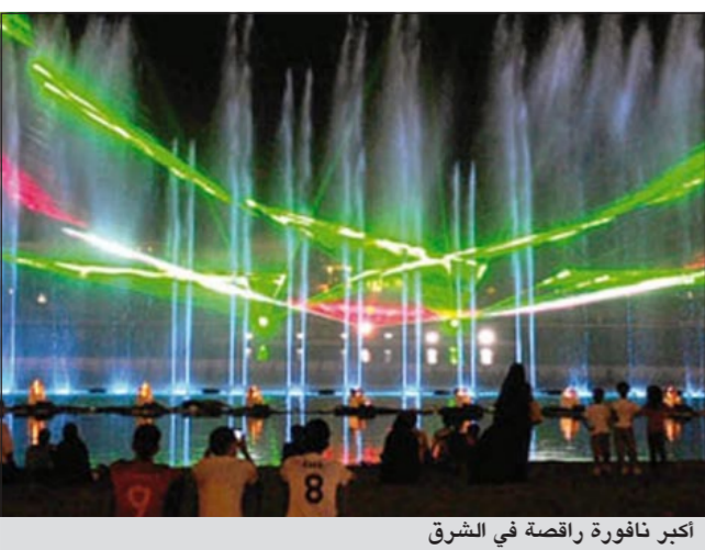
أكبر نافورة راقصة في الشرق

العربية.نت: ألقى وزير الثقافة السعودي خالد بن عبد العزيز كلمة الحزبية منذ الأربعاء، ويستمر حتى غد الثلاثاء وتقام أنشطة المهرجان في جميع المراكز والمنزهات والمجمعات التجارية والترفيهية بهدف تعزيز مكانة عروس البحر الأحمر على خريطة السياحة محليا واقليميا، وظهرت النافورة ابداعية الراقصة للمرة الأولى في المملكة الأربعاء الماضي خلال تدشين المهرجان، وتابعها أكثر من 100 ألف شخص خلال الأيام الخمسة الأولى وبواقع 20 ألف يوميا وسط توقعات بأن يصل زوارها الي ما يزيد عن 200 ألف شخص خلال الأيام التسعة التي تقدم فيها عروضها على كورنيش جدة الأوسط، حيث تبدأ عند الغائمة مساء وتستمر حتى الواحدة بعد منتصف الليل، وتقدم 6 عروض يوميا بواقع عرض على رأس الساعة، ووفقا لصحيفة «المدية» وقع الاختيار من قبل اللجنة التنفيذية للمهرجان على موقع الكورنيش الأوسط بعد أن