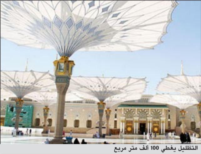
التظليل يغطي 100 ألف متر مربع