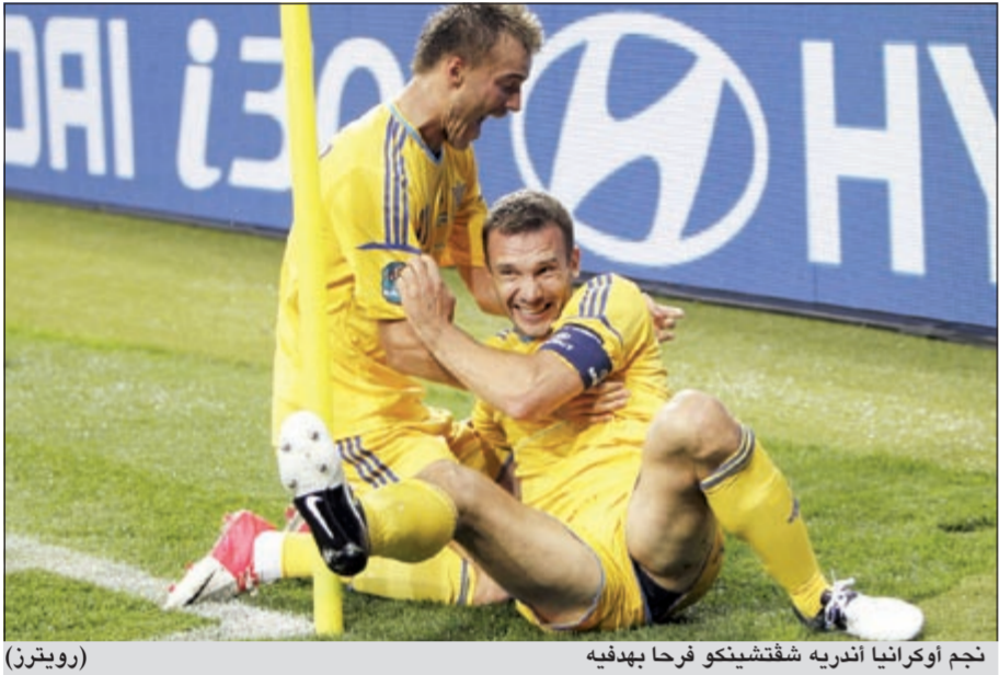
نجم أوكرانيا أندريه شفتشينكو فرحا بهدفه

سجله المهاجم السويدي زلاتان ابراهيموفيتش الى الفوز بهدفين: أشعر بأثني في العشرين من عمري رغم مباريات الفريق في يورو 2012. وقال شفتشينكو الذي نجح في تحويل تأخر بلاده بهدف الذي صعبه، لم تكن لنخسر في هذه المباراة.