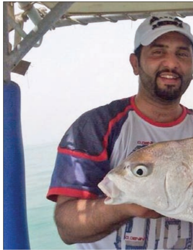
وهذا ثغور ثاني

به فهل وجدت لسمكتك العزيزة أماكن ممتازة تتواجد بها؟ • بالنسبة حق الشعم فان مضخة الصببة والطبعانة والدفان من أفضل واحسن الأماكن لتواجده، اما بالنسبة للبالول فان أم الفحل لا يعلى عليها بالبوليل والذي جرب هذه الاماكن سوف يعرف صحة كلامي.