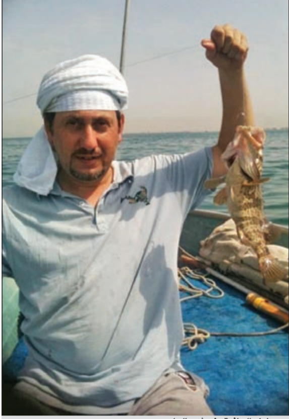
يعطيك العافية خوش بالول