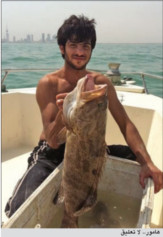
هامور.. لا تعليق