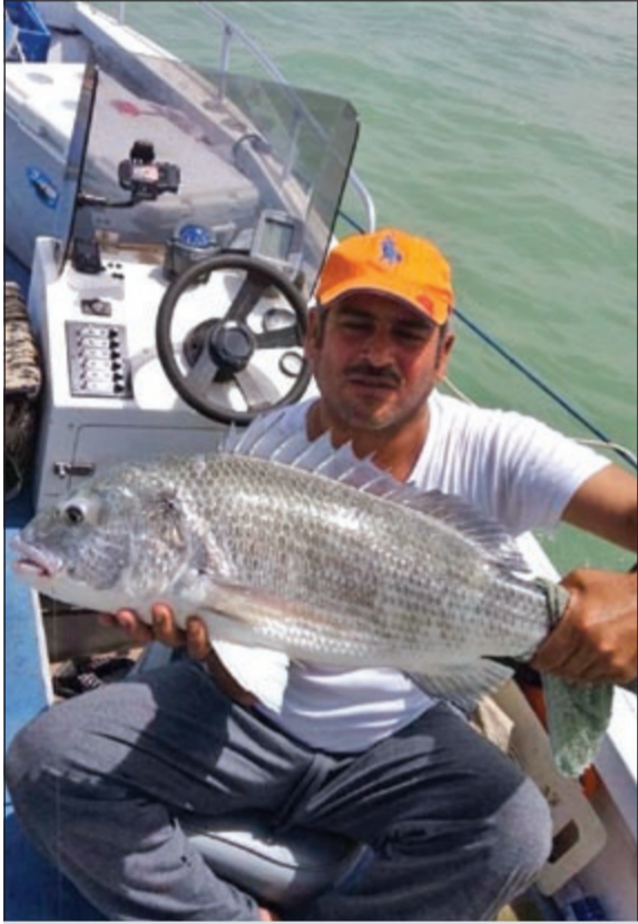
سبيطي يرد الروح