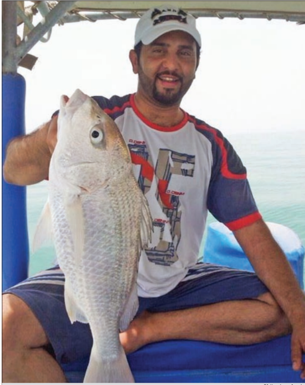
يا عيني على الثغور